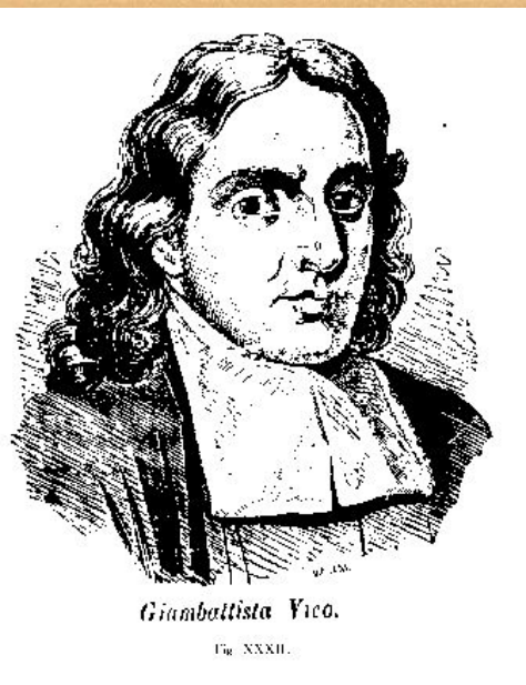
Giambattista Vico. Гр. XXXII.