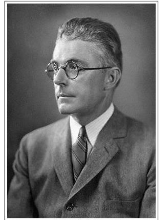
Д. Уотсон (1878-1958) американский психолог, основоположник бихевиоризма

Задача психологии – установить однозначные отношения между стимулами и реакциями.