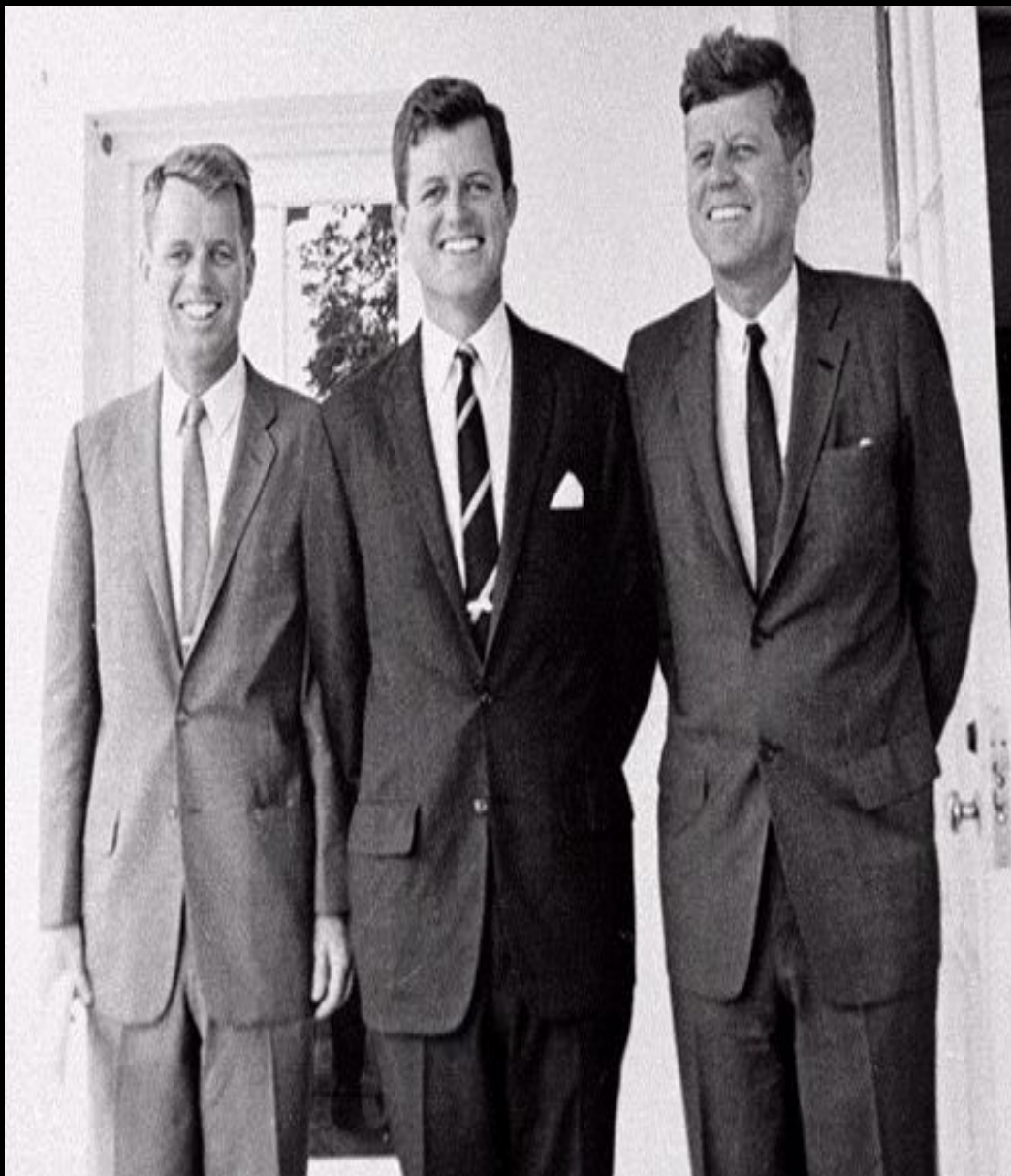
На фотографії (справа наліво): Джон, Едвард і Роберт Кеннеді

У зовнішній - критикував політику Трумена по відношенню до Китаю, але підтримував НАТО і план Маршалла.