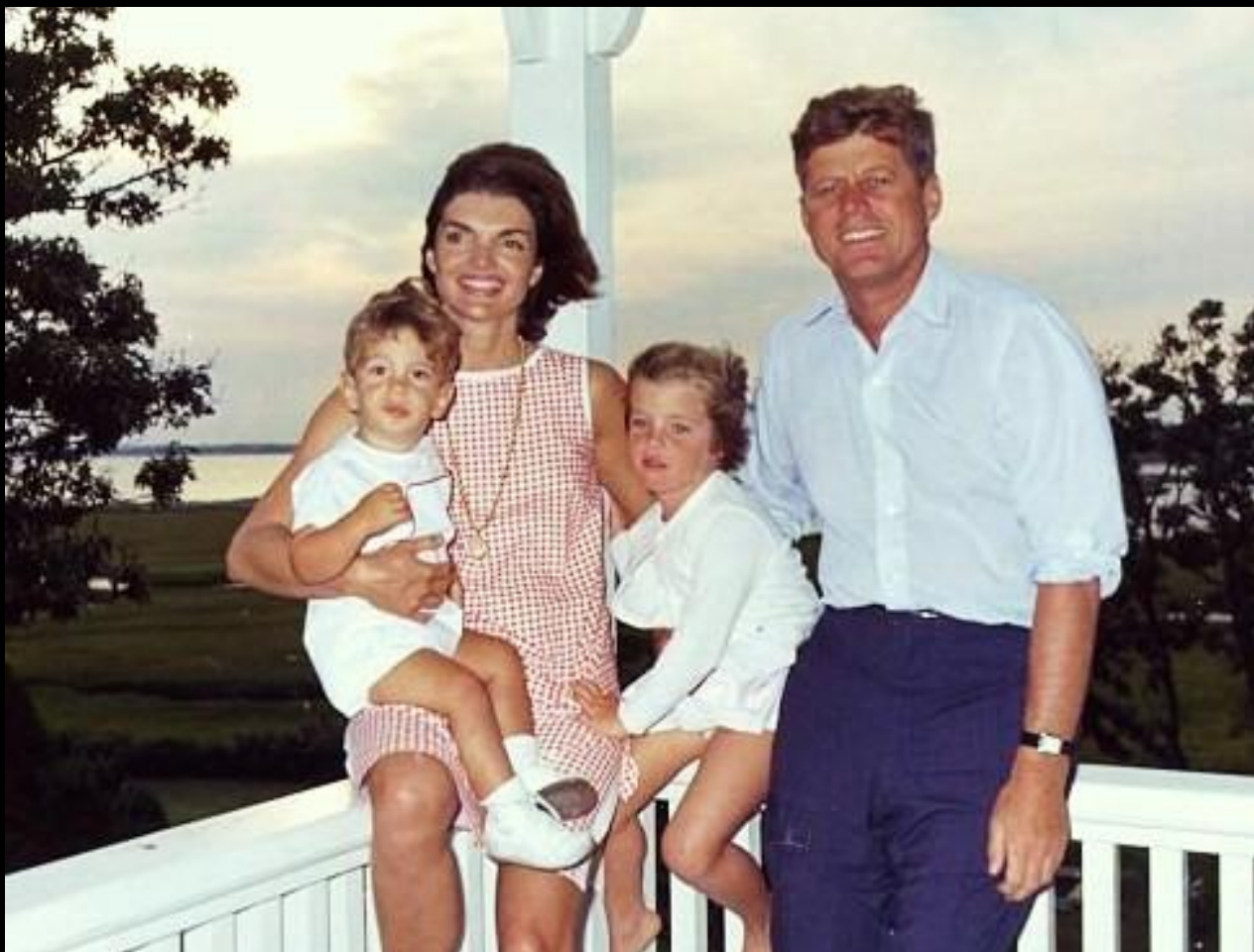
На фотографії: Джон Кеннеді зі своїми дітьми і дружиною, 1962 рік.