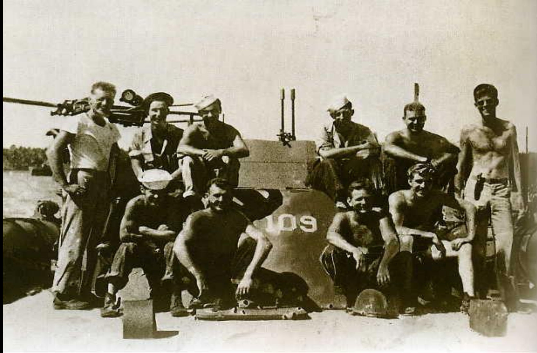
Лейтенант Джон Кеннеді (стоїть праворуч) на борту USS PT-109 разом з членами екіпажу, 1943 рік