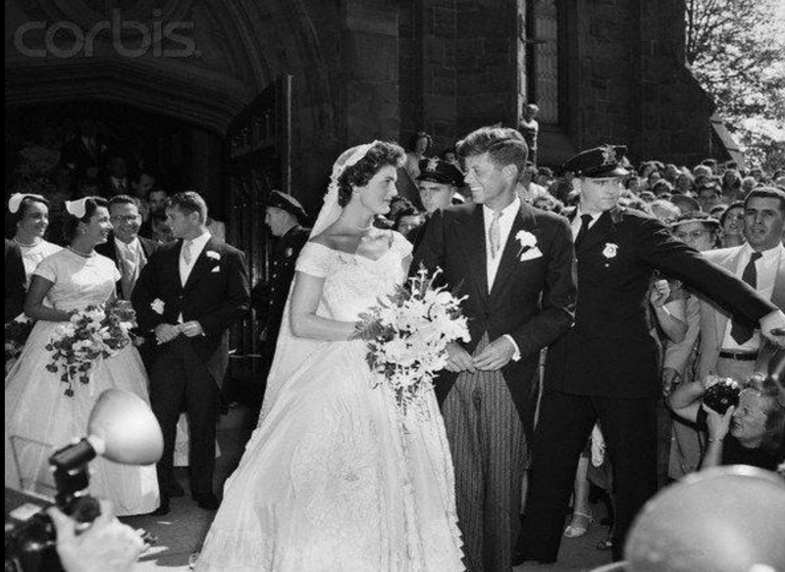
Весілля Джона Кеннеді і Жаклін Чи Був'є, 1953 р.