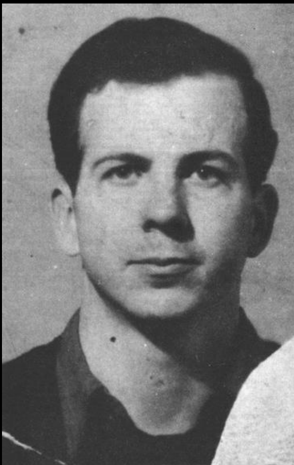
Лі Харві Освальд