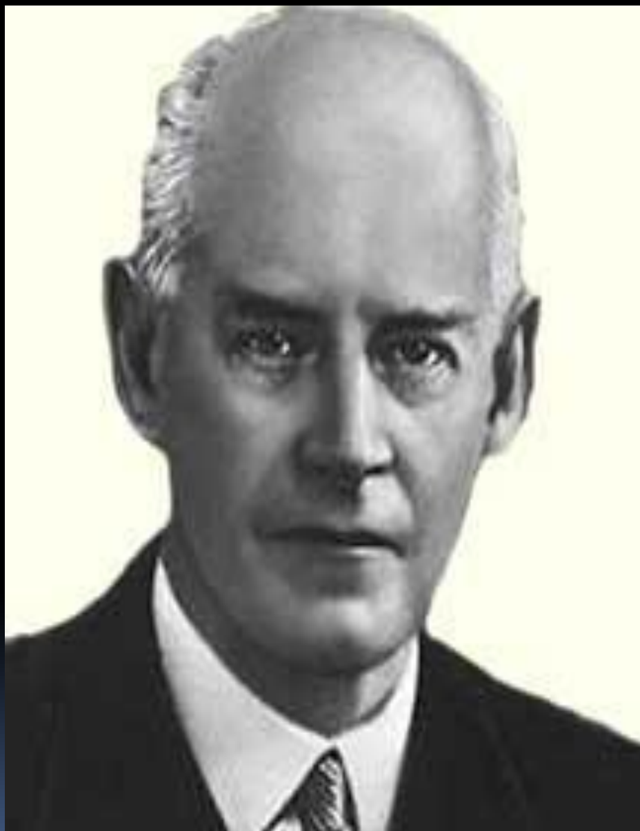
ДЖОН ГОЛСУОРСИ (GALSWORTHY) (1867-1933)