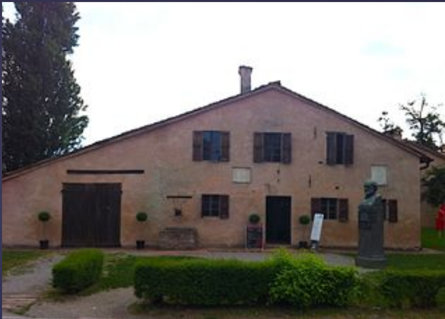
Дом Джузеппе Верди