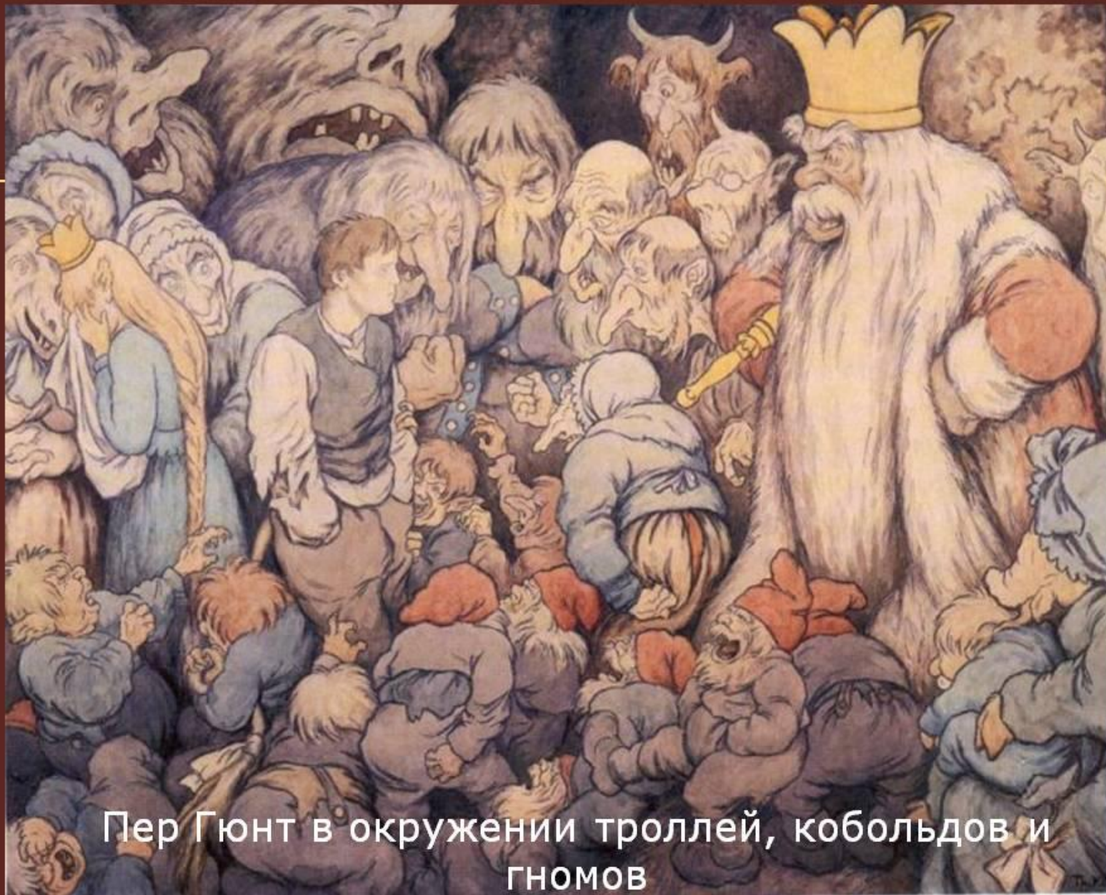
Пер Гюнт в окружении троллей, кобольдов и ГНОМОВ