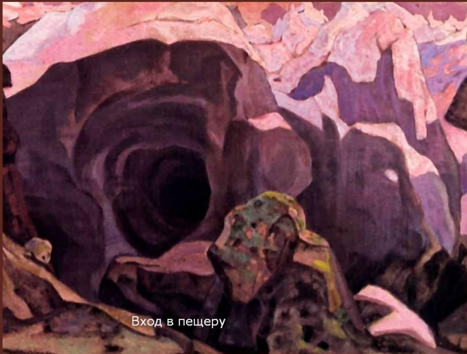
Вход в пещеру