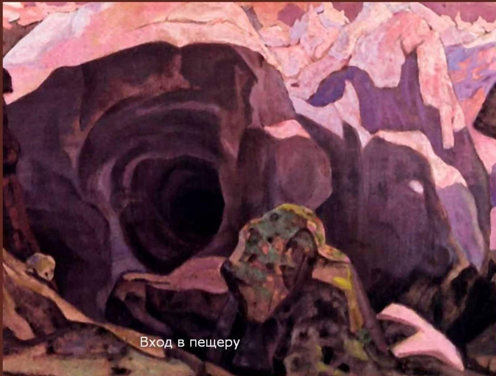
Вход в пещеру