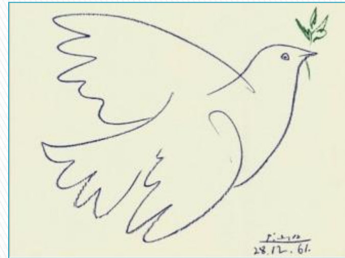
Пабло Пикассо «Голубь мира»