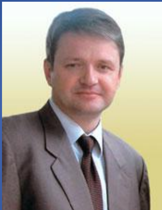
Александр Николаевич Ткачев