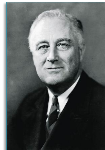
президент США (1932-1945) Ф. Д. Рузвельт

Во время Великой Депрессии США потеряли треть ВВП. Это вынудило Ф. Д. Рузвельта перейти на российскую модель регулируемого рынка. Подтверждением этого исторического факта является теория конвергенции (сближения моделей функционирования капитализма и социализма), которая объяснила (Нобелевский лауреат Д. Гелбрейт), что современный капитализм может функционировать лишь на основе социалистической модели регулируемого рынка, только как модель государственно-монополистического капитализма. Это обеспечило США практически бескризисное развитие во второй половине XX в. (табл. 3). Однако развитые страны, перейдя к регулируемому рынку, реально обеспечили в 2 раза меньшие темпы прогресса, имея возможность и затратив почти в десять раз больше ресурсов. Частная собственность исключила применение научного оптимизационного планирования и резко снизила эффективность капиталистического способа производства, стала главным препятствием на пути прогресса. Это обстоятельство является экономической основой устойчивой перспективы применения российских моделей в 21 веке.