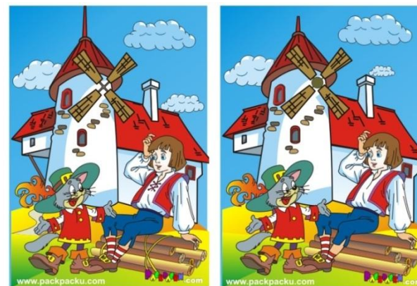
Найди 12 отличий