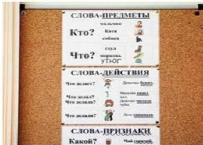
Визуальная подсказка: вопросы к словам и словосочетаниям крупно написаны рядом с ними