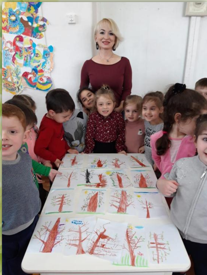
Рисование: «Весенний лес»