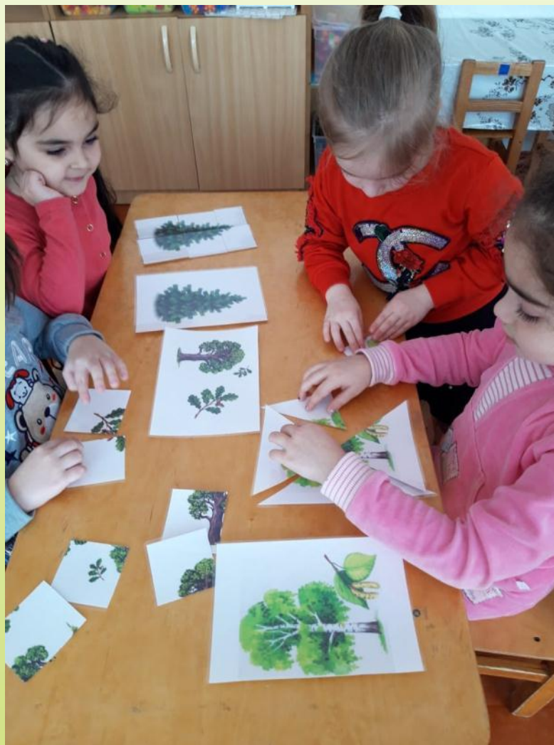
Дидактическая игра «Собери дерево»