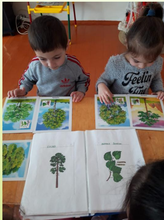
Рассматривание иллюстраций деревьев.