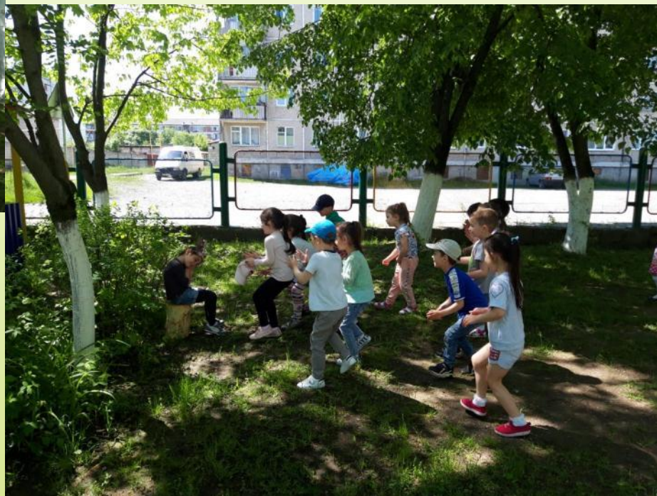
Подвижная игра «У медведя во бору»