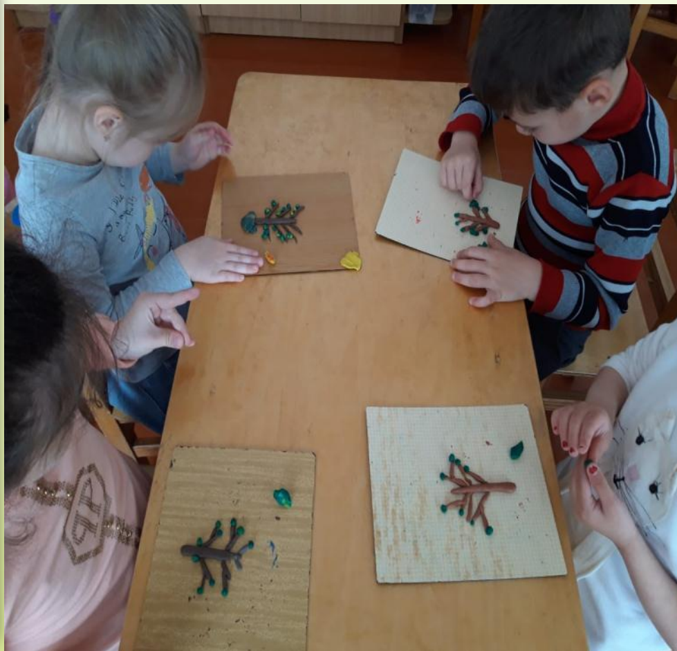
Лепка: «Весеннее дерево»