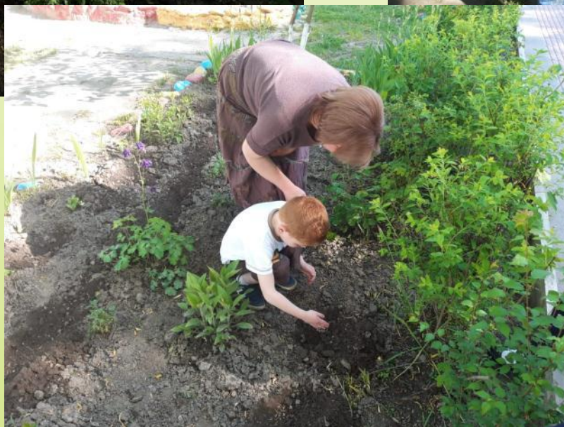
Труд на участке. Посадка цветов.