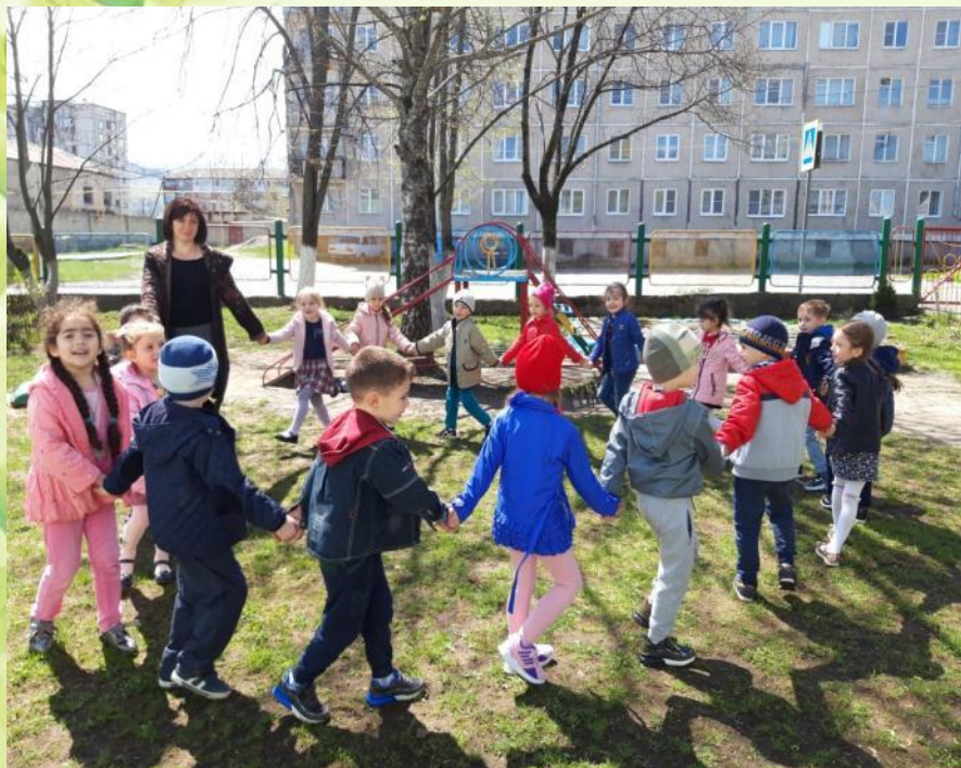
Подвижная игра « 1, 2, 3 – к дереву беги! »