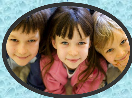
Дети 5 – 7 лет