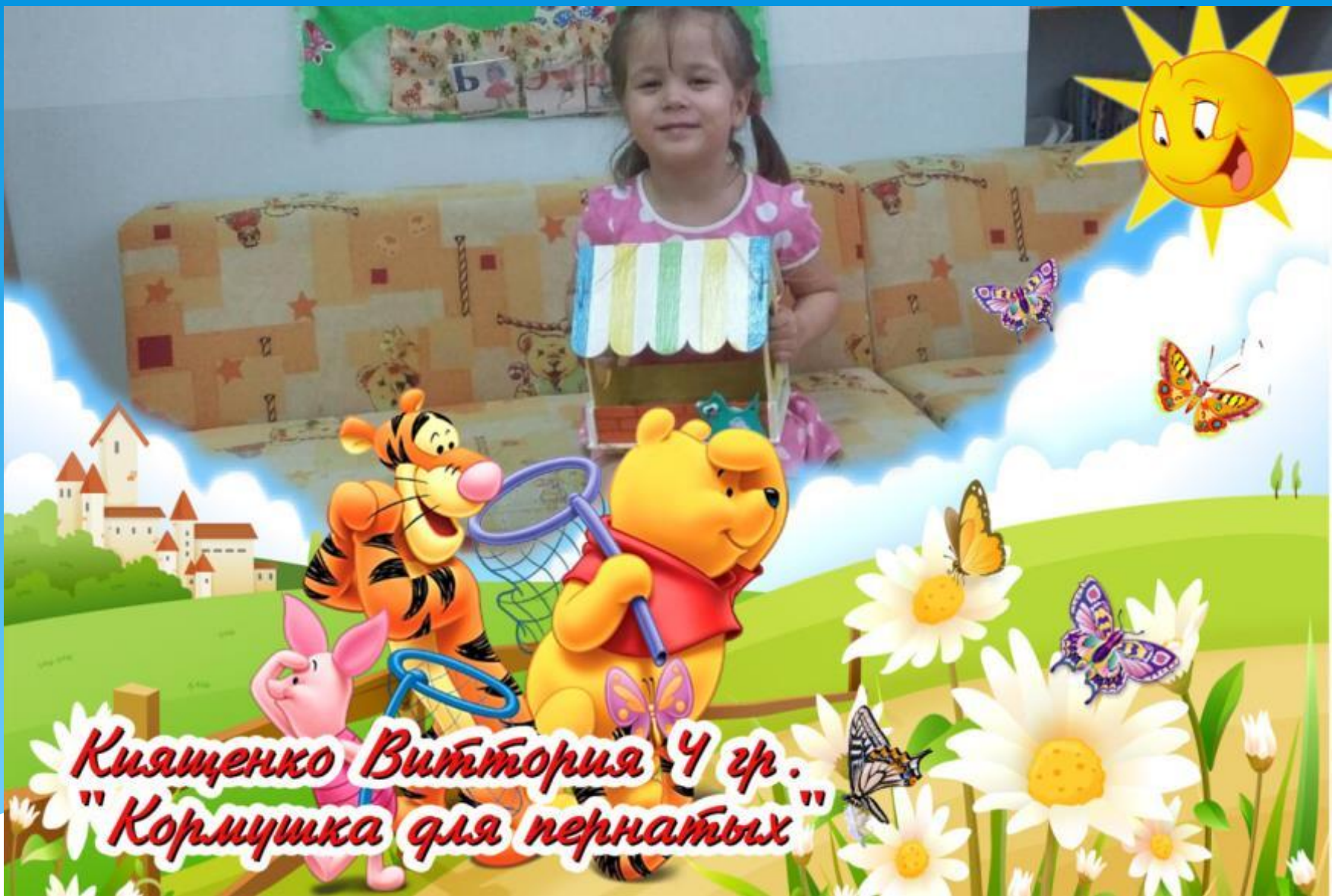
Князенько Виттория 4 гр. "Кормушка для пернатых"