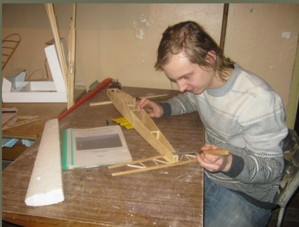
Работа над фюзеляжем стабилизатора