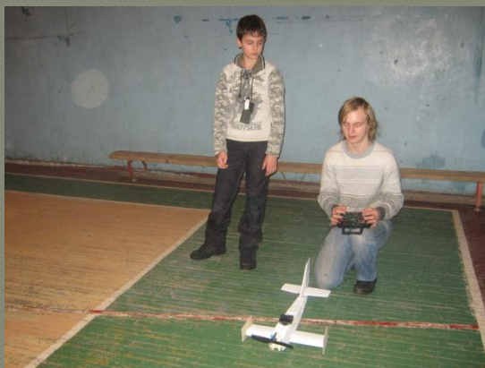
Сначала проходили в спортивном зале