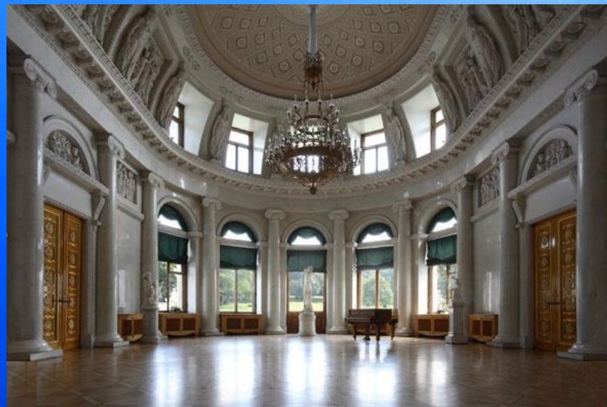
Главный зал в 2011 году