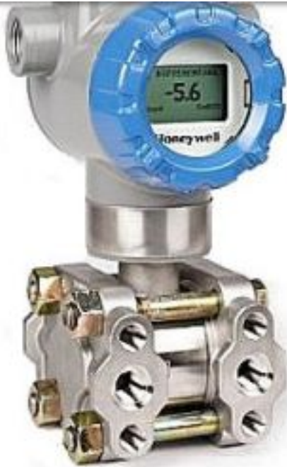
Рисунок 1. В датчиках перепада давления STD800 применяется проверенный на практике пьезорезистивный измерительный элемент