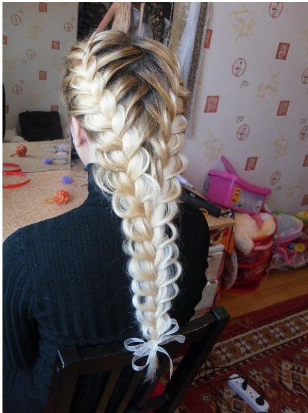
Французская внутренняя коса