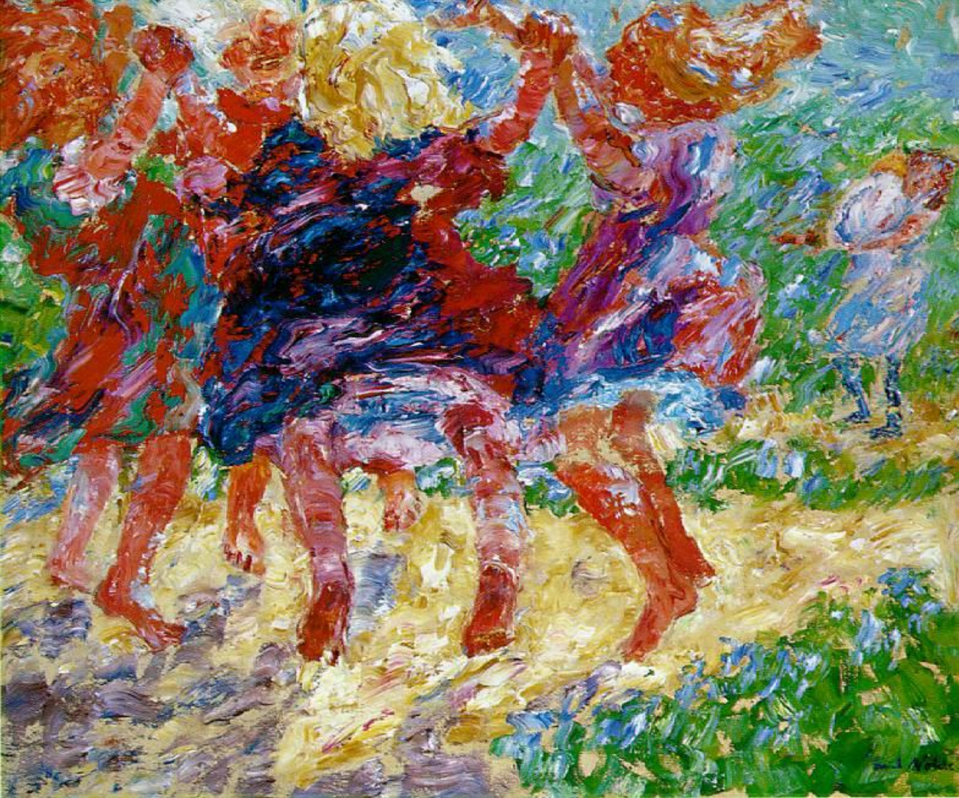
Эмиль Нольде Wildly Dancing Children 1909