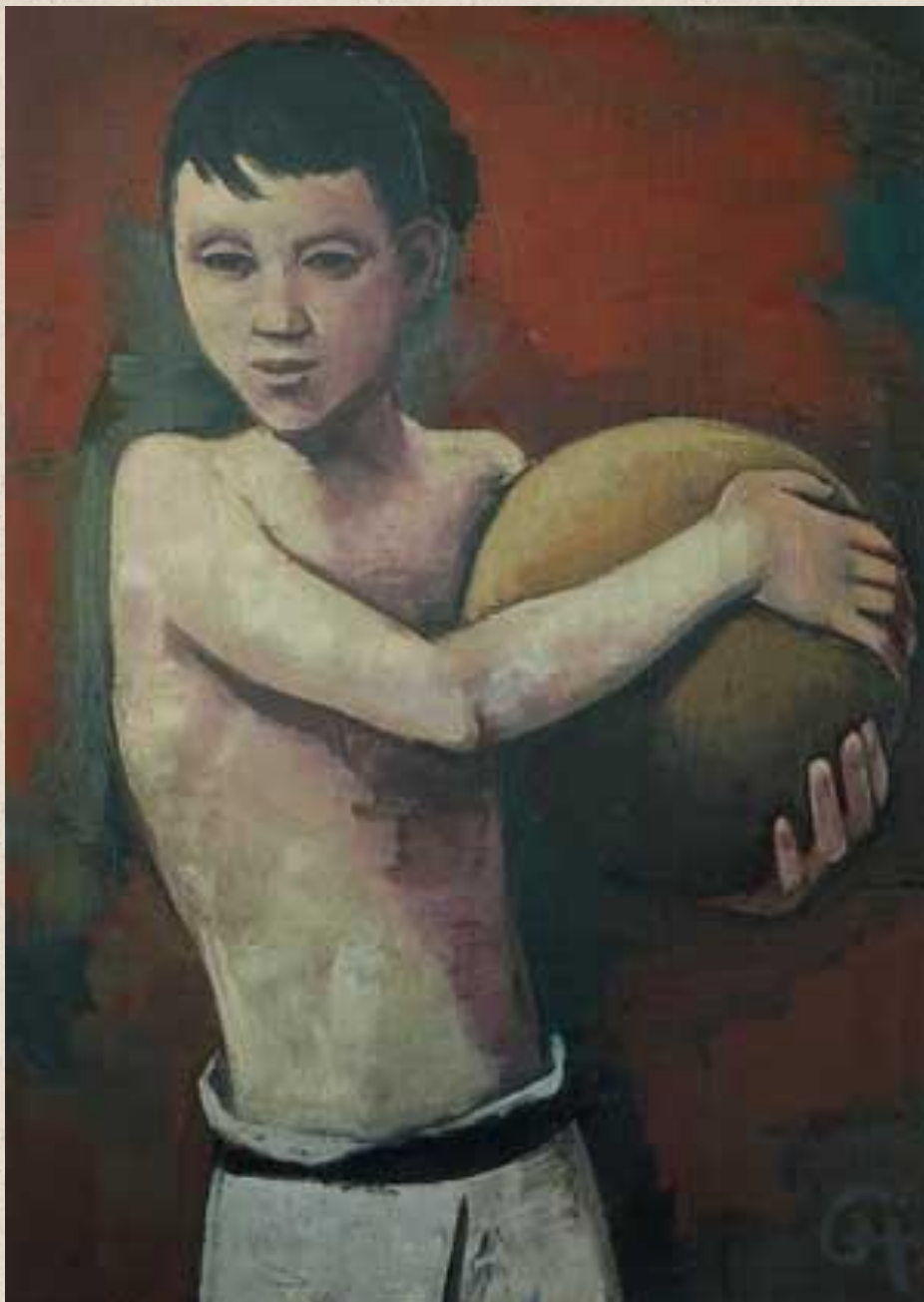
КАРЛ ХОФЕР. МАЛЬЧИК С МЯЧОМ