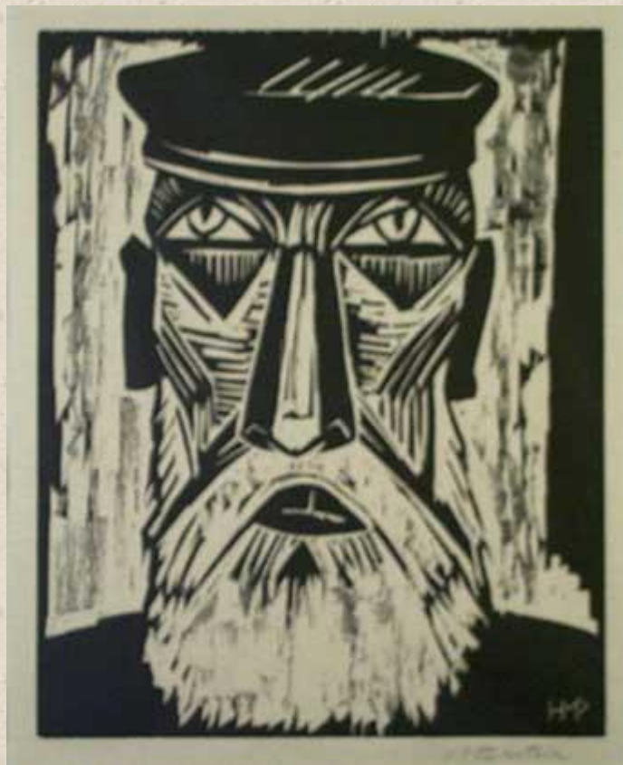
МАКС ПЕХШТЕЙН. ГОЛОВА БОРОДАТОГО РЫБАКА