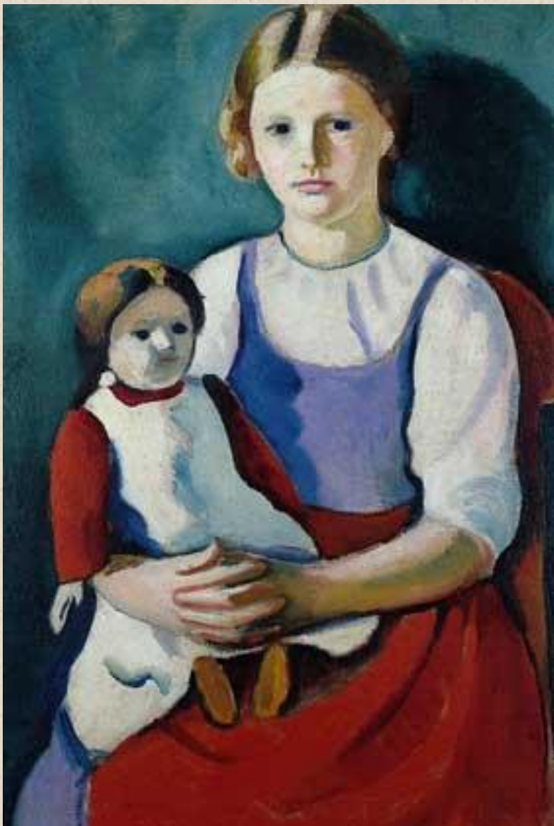
АВГУСТ МАККЕ. ДЕВУШКА С КУКЛОЙ