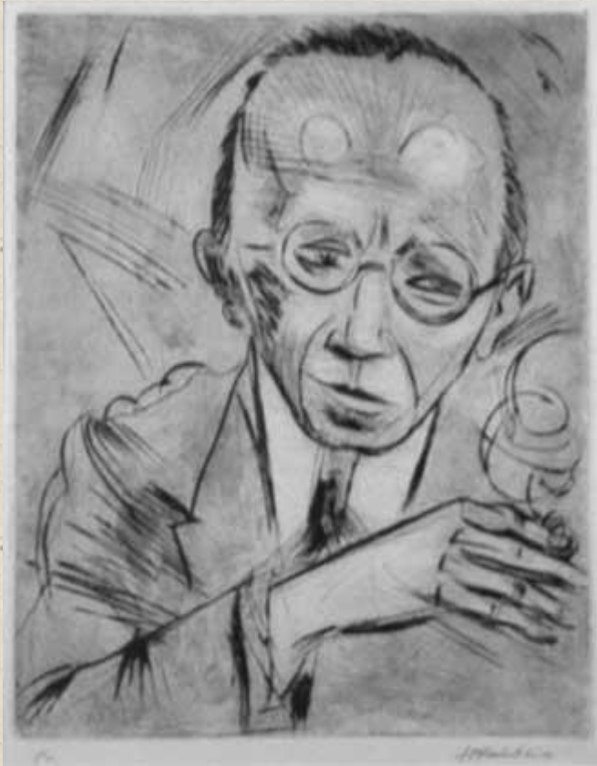
МАКС ПЕХШТЕЙН. КРИТИК