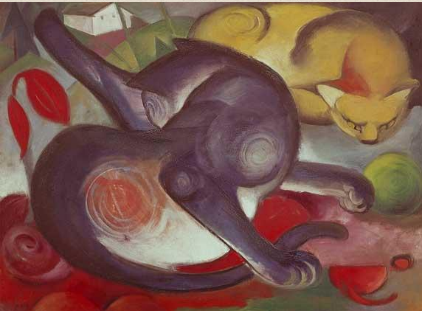
ФРАНЦ МАРК. ДВЕ КОШКИ