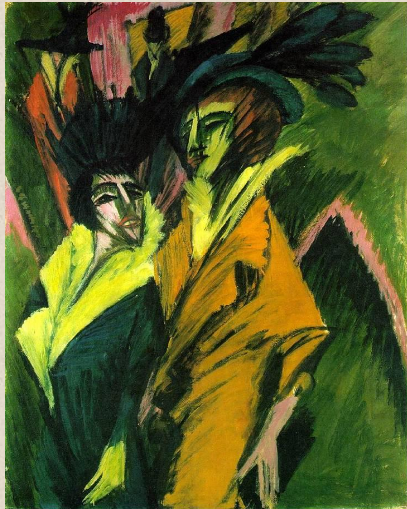
Ernst Ludwig Kirchner Two Women in the Street 1914