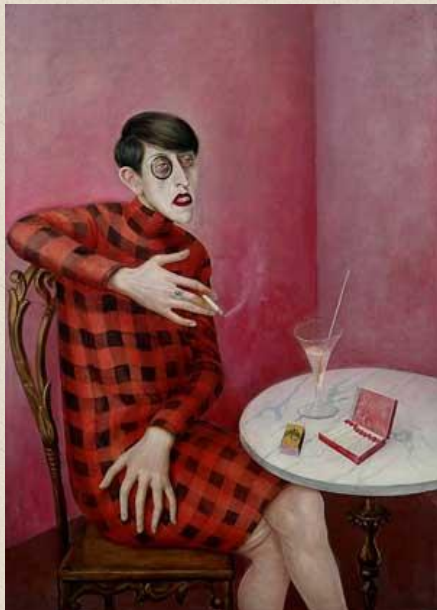
ОТТО ДИКС. ПОРТРЕТ СИЛЬВИИ ФОН ХАРДЕН. 1926