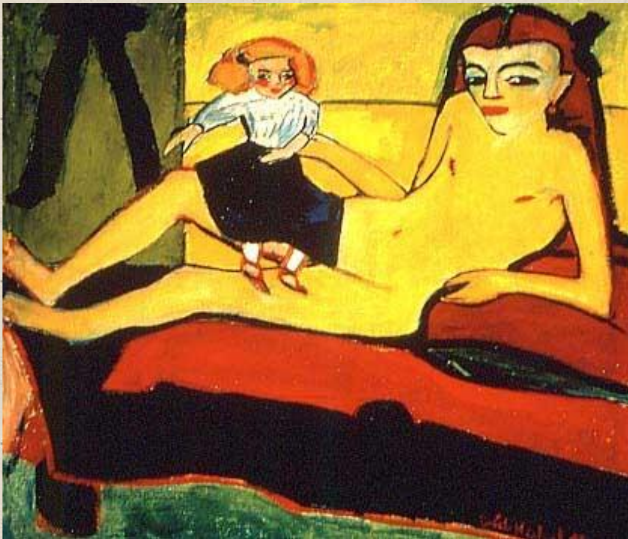
ЭРИХ ХЕККЕЛЬ. ДЕВОЧКА С КУКЛОЙ