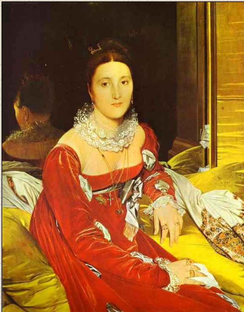
J.A.D. Ingres (1780-1867) "Madam de Senonnes portretas, 1814-16.