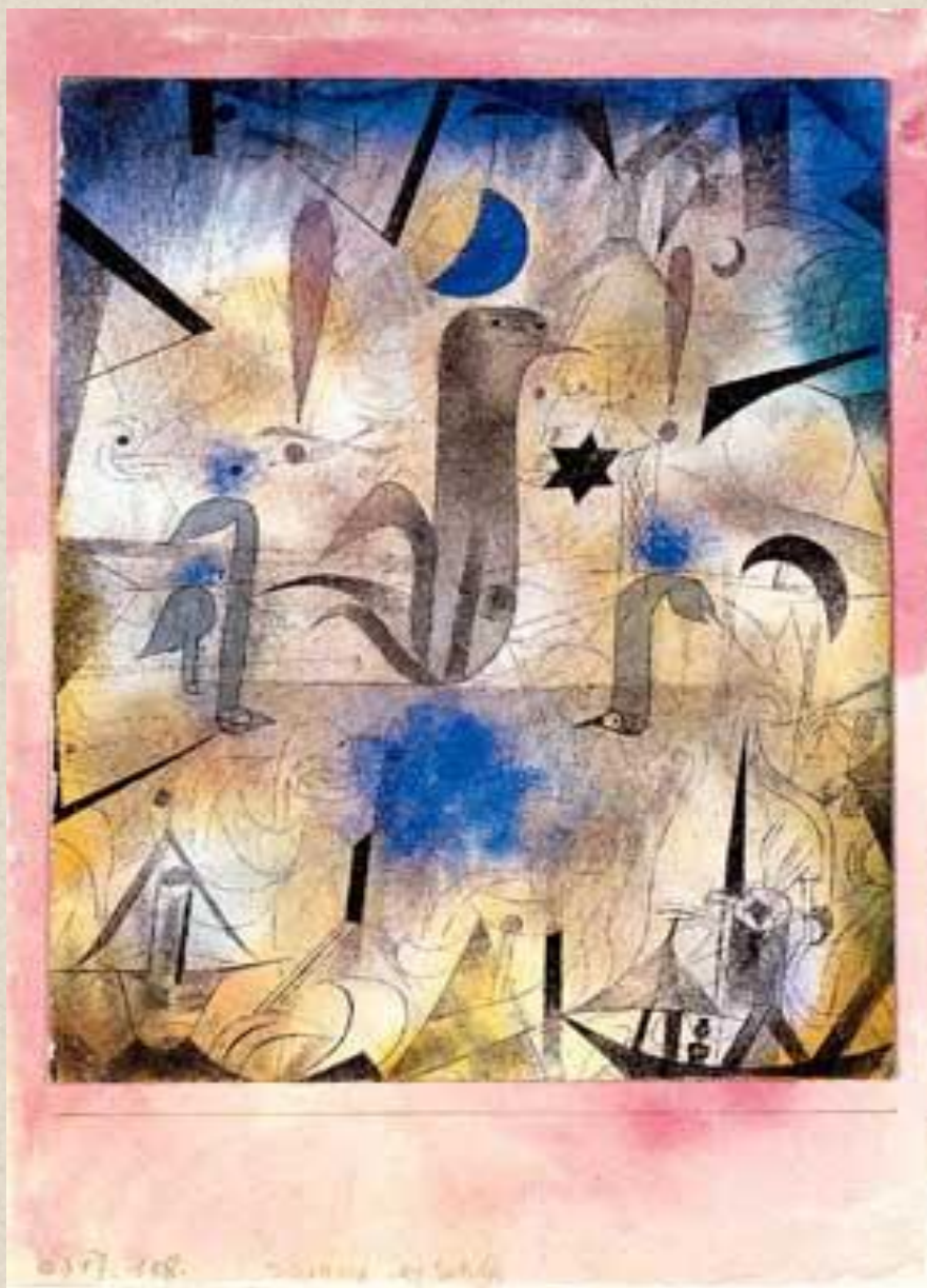
ПАУЛЬ КЛЕЕ. ПРЕДУПРЕЖДЕНИЕ КОРАБЛЕЙ. 1917