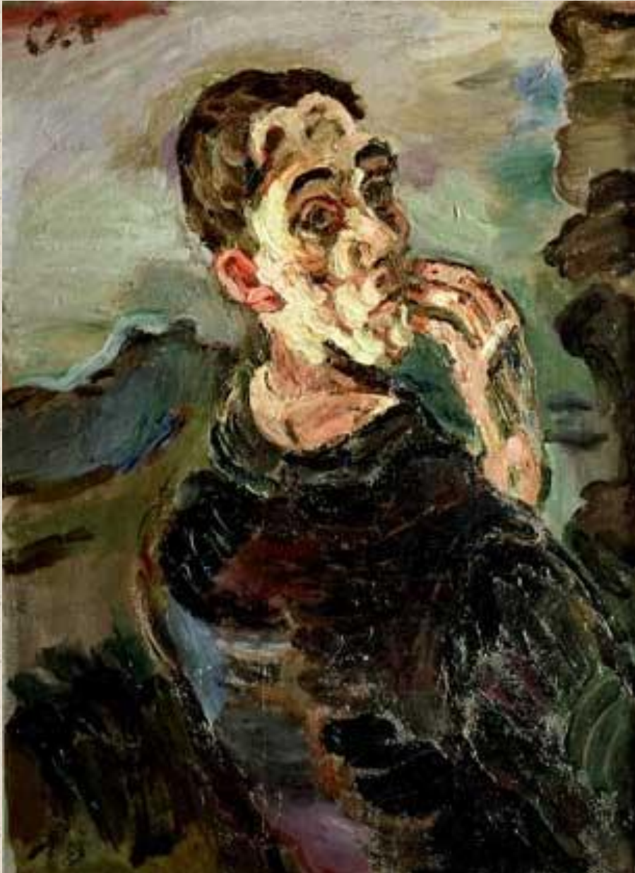
ОСКАР КОКОШКА. АВТОПОРТРЕТ. 1918–1919. Коллекция Рудольфа Леопольда, Вена.