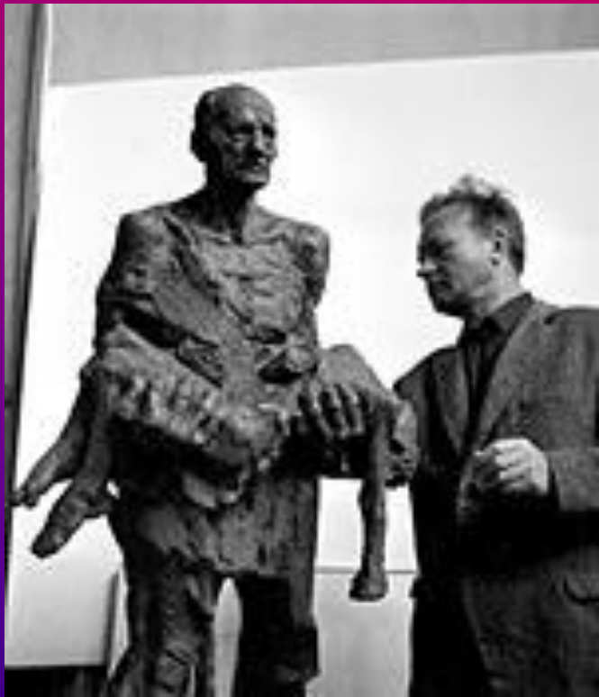
1968г. Скульптор - народный художник БССР С. Селиханов

В марте 1967г. был объявлен конкурс на создание проекта мемориала. В конкурсе победил коллектив архитекторов: Ю. Градов, В. Занкович, Л. Левин, скульптор народный художник БССР С. Селиханов. «Работа над проектом захватила нас, - вспоминает Леонид Левин - мы придумали венцы срубов на месте бывших домов,obeliski в виде печных труб, но чего-то не хватало. Заросшее травой поле, свидетель трагедии, хранило мертвую тишину. И вдруг в этой щемящей душу тишине неожиданно запел жаворонок. Звук, тут должен быть звук!», - так родилась идея колоколов Хатыни.