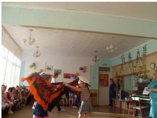
ДЕНЬ ЗАЩИТНИКА ОТЕЧЕСТВА