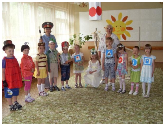
В ГОСТЯХ У СВЕТОФОР