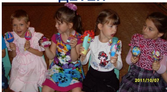
САМОДЕЛЬНЫ Е ИНСТРУМЕН ТЫ