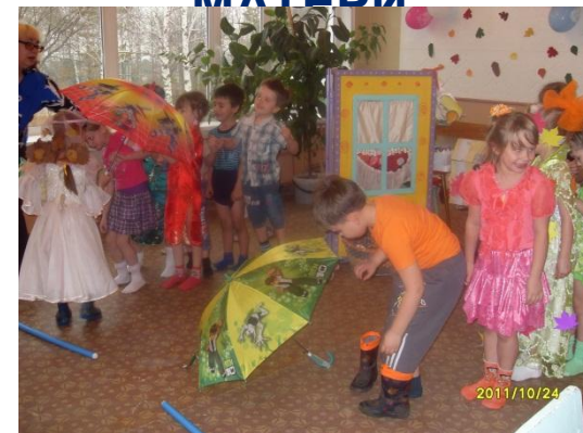
ОСЕНЬ К НАМ ПРИШЛА