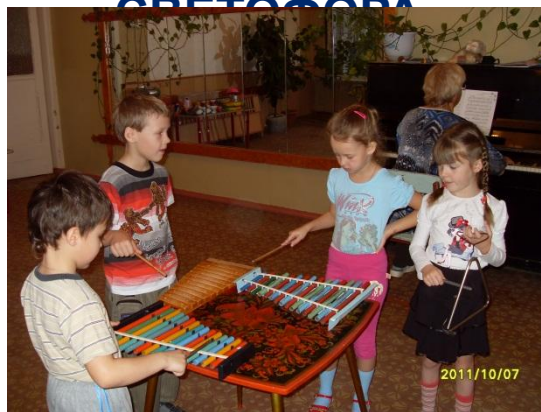
ИГРАЕМ В ОРКЕСТРЕ