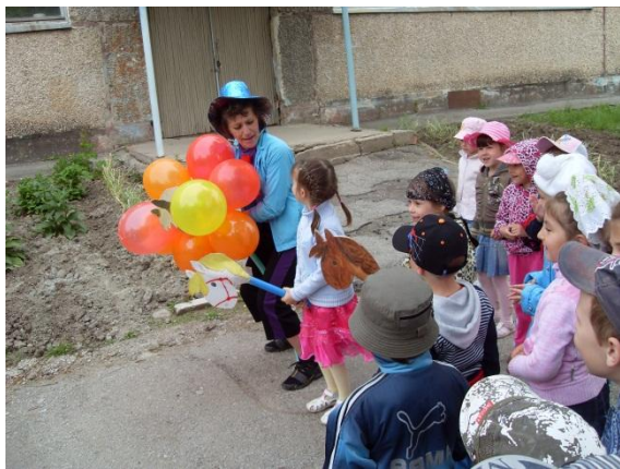
ДЕНЬ ЗАЩИТЫ ДЕТЕЙ