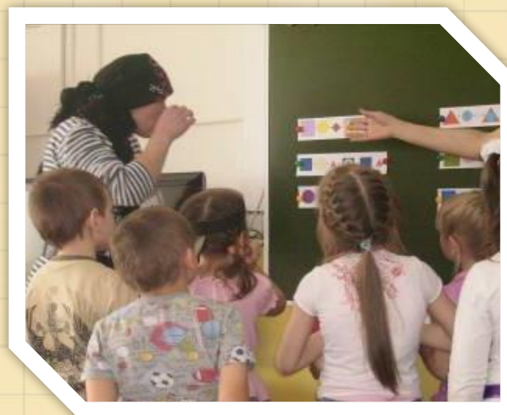
Технология игровой обучающей ситуации