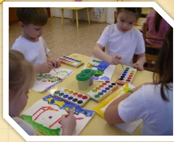
Арт - технология