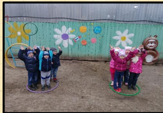
«Готовимся к полетам» 2015