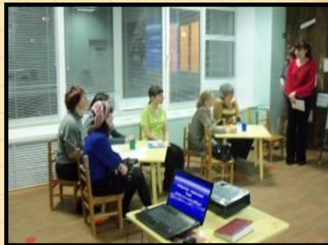
Консультация «Собираемся в детский сад» 2016