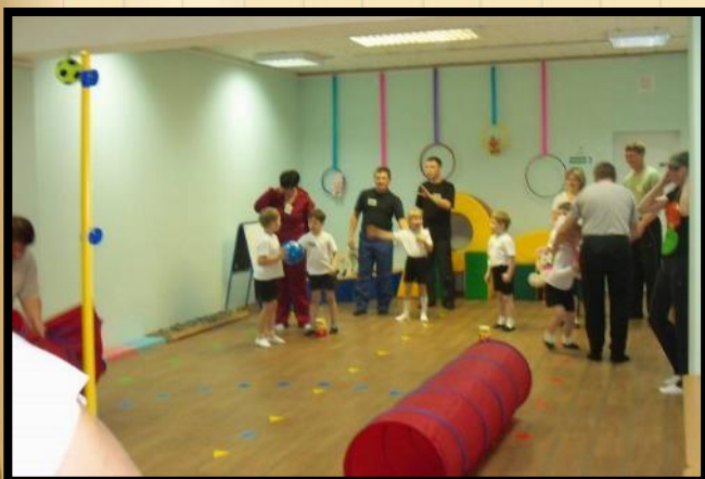
Спортивное развлечение «Светофорчик» 2015