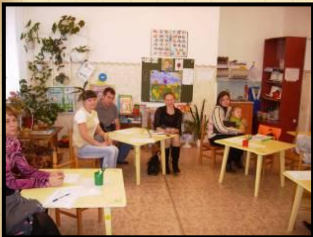
Собрание «Возрастные особенности детей 2-3 лет» 2016