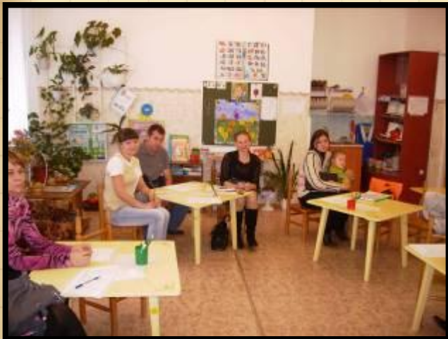
Собрание «Секреты психологического здоровья» 2009