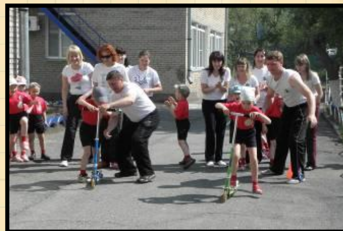
«Веселые старты» 2011