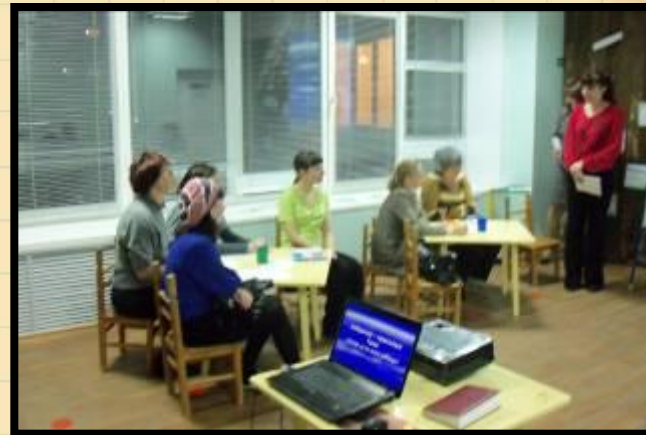
Консультация «Знаете ли вы своего ребенка?» 2010