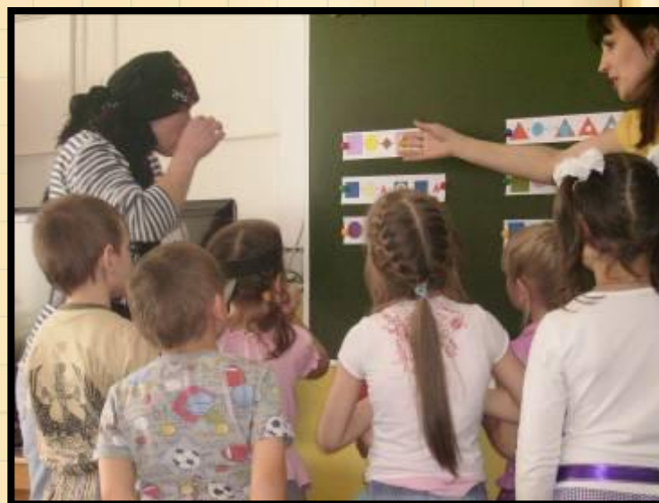
Технология игровой обучающей ситуации