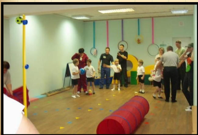
Спортивный досуг «В гостях у Семафорчика» 2010