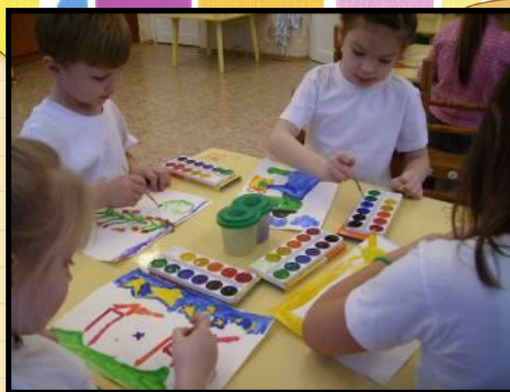
Арт - технология