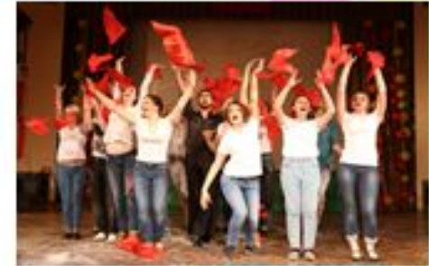
День специальности «Государственное и муниципальное управление»