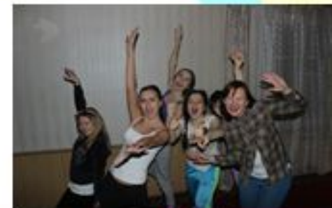
Общий выезд кафедры на базу отдыха