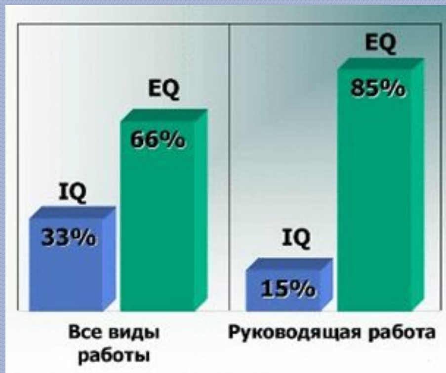
Рис. 1. Важность эмоционального интеллекта

По оценкам Гоулмана эмоциональный интеллект существенно важнее рационального, особенно для менеджеров(рис. 1).