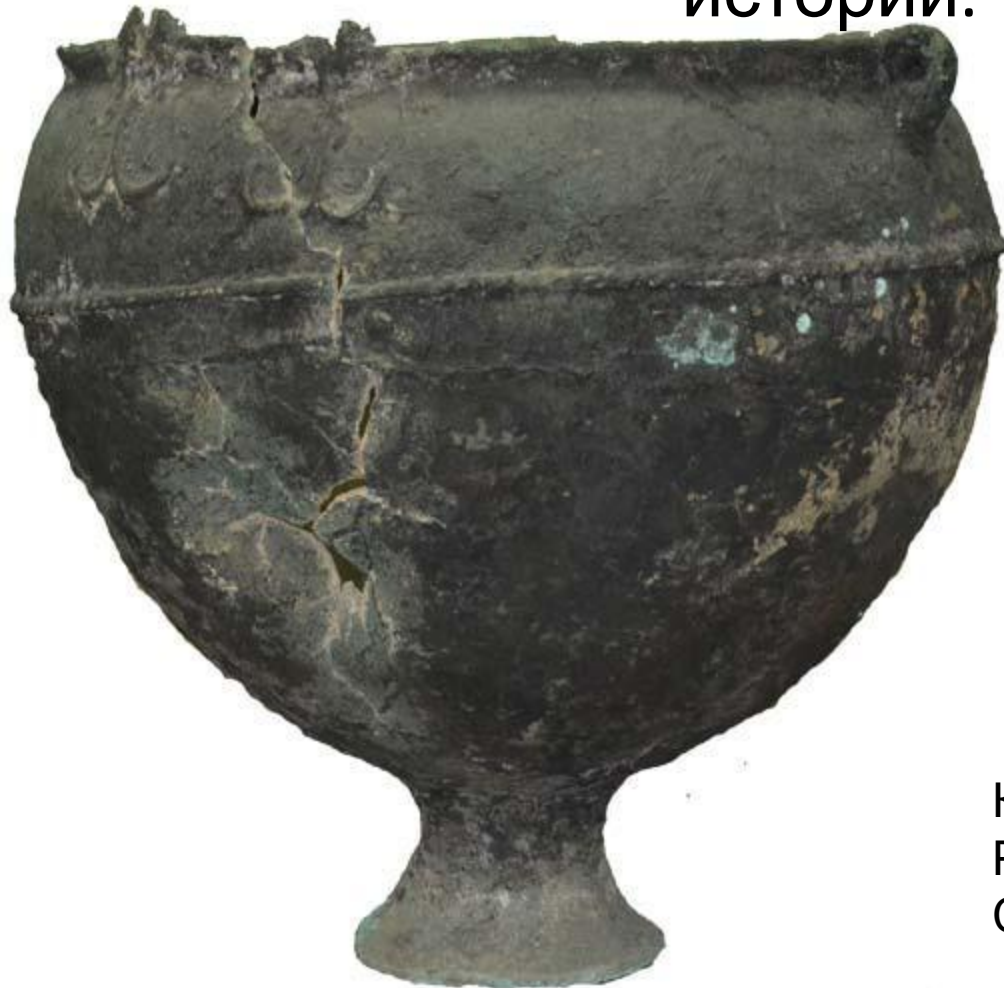
Котел бронзовый. Ранний железный век. Сарматы. IV- II вв. до н. э

Музей знакомит своих посетителей с прошлым родного края. Крупнейшей коллекцией музея является археологическая, объединяющая более 8000 экспонатов. Она отражает все периоды древней истории.