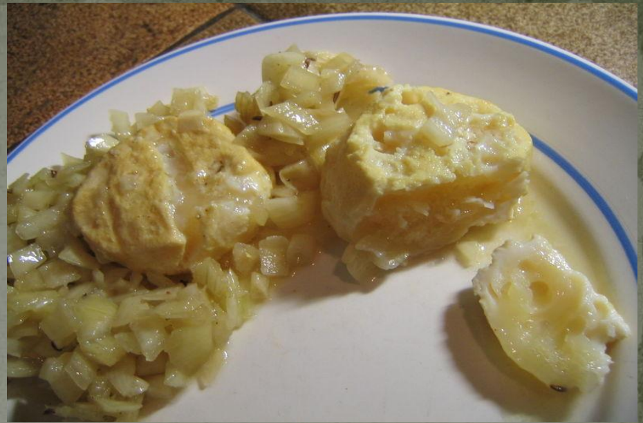
Handkäse mit Musik Labskaus mit Spiegelei, Gewürzgurke und Rote Bete