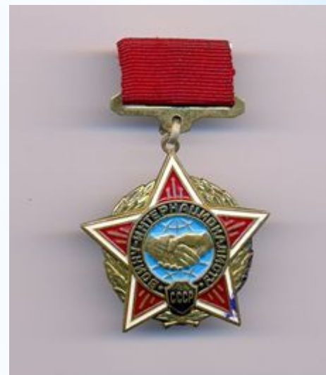
Медаль «ВОИНУ- ИНТЕРНАЦИОНАЛИСТУ»