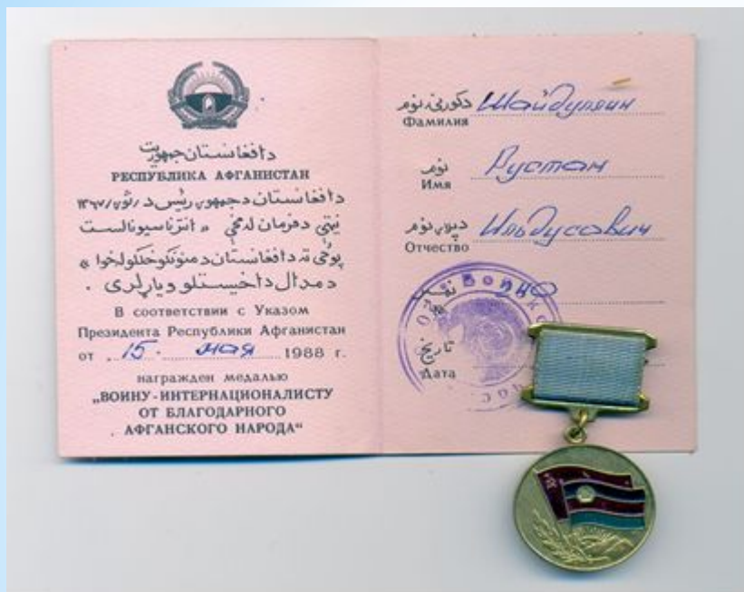
Медаль «ВОИНУ - ИНТЕРНАЦИОНАЛИСТУ ОТ БЛАГОДАРНОГО АФГАНСКОГО НАРОДА»