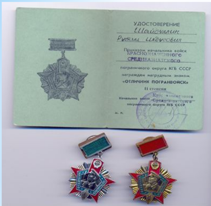
Нагрудный знак «ОТЛИЧНИК ПОГРАНВОЙСК» I и II степени