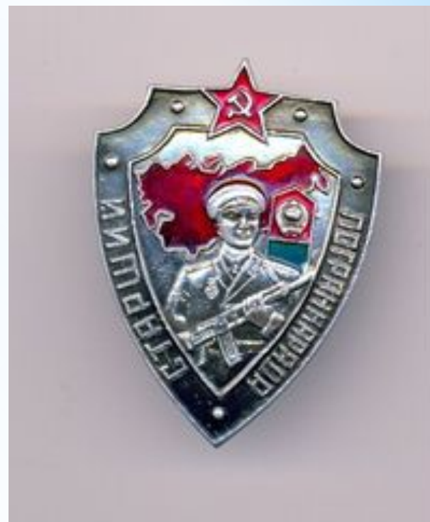
Нагрудный знак «СТАРШИЙ ПОГРАННАРЯДА»