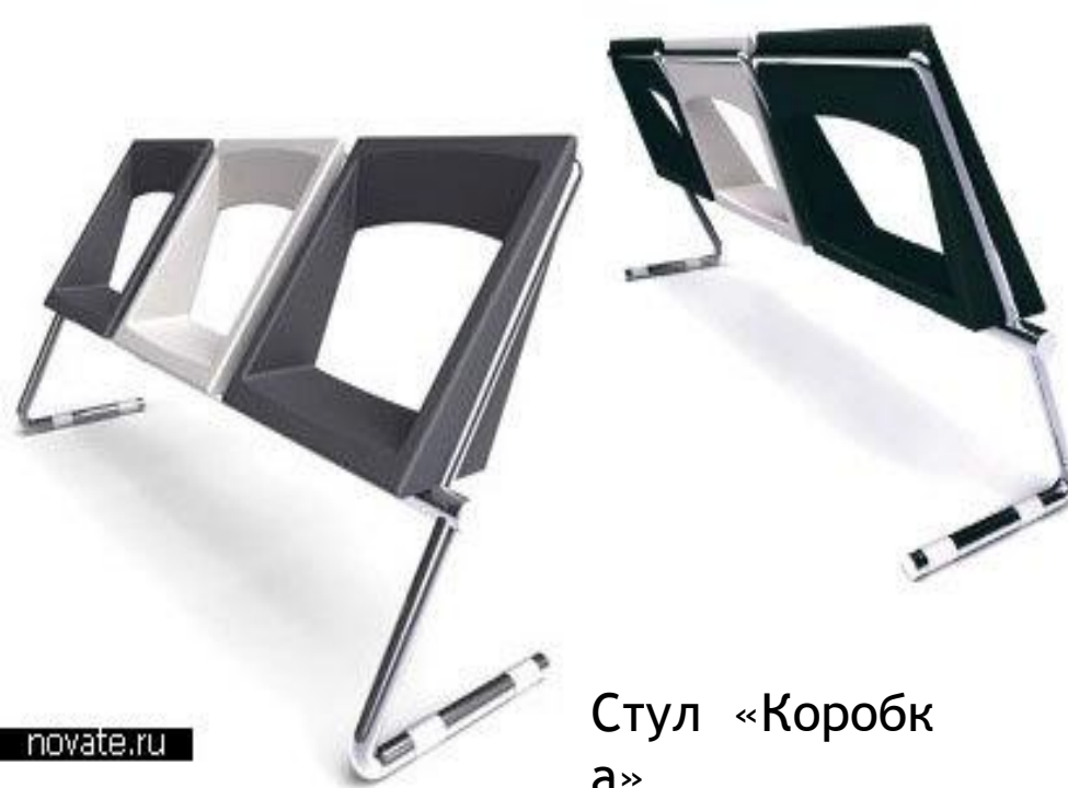
Стул «Коробк а»