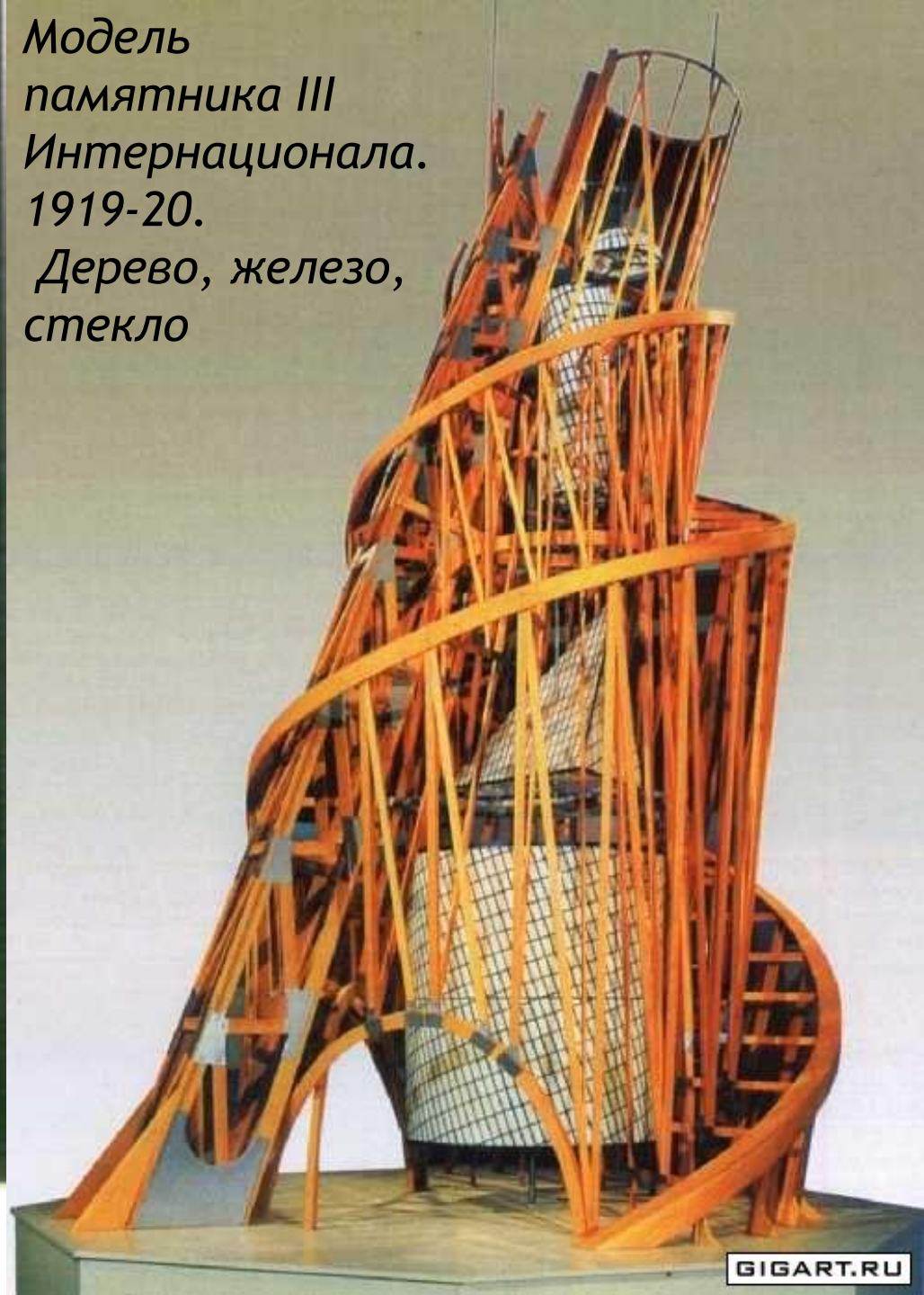
Модель памятника III Интернационала. 1919-20. Дерево, железо, стекло