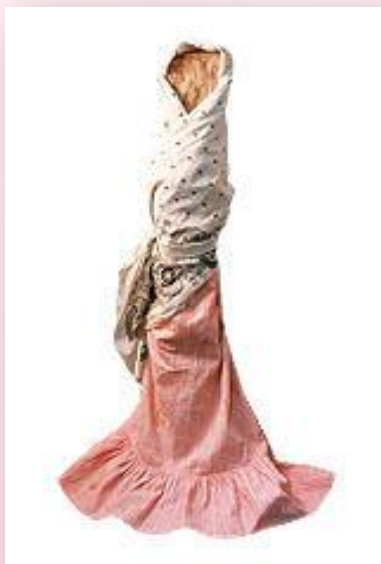
« Полено »