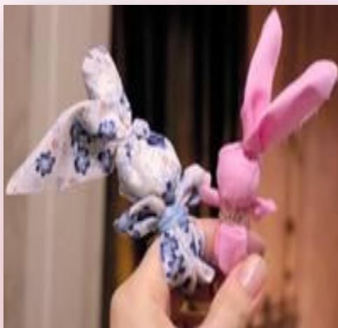
« Зайчик на пальчик »