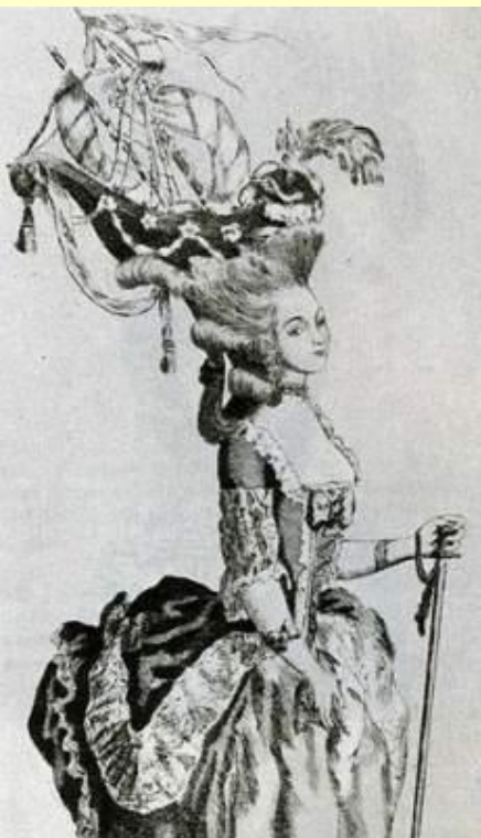
A-la Belle Poule