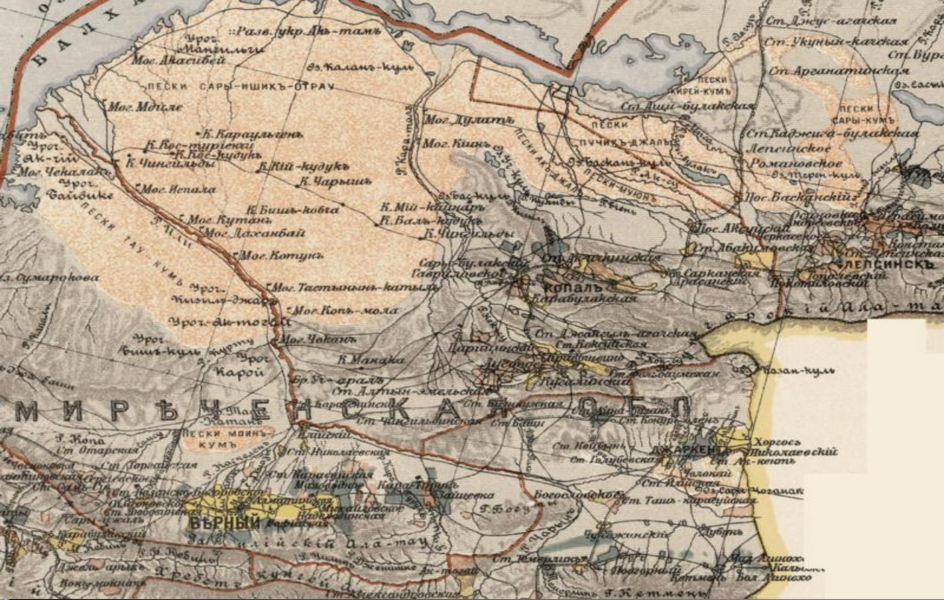
Семиреченское казачье войско