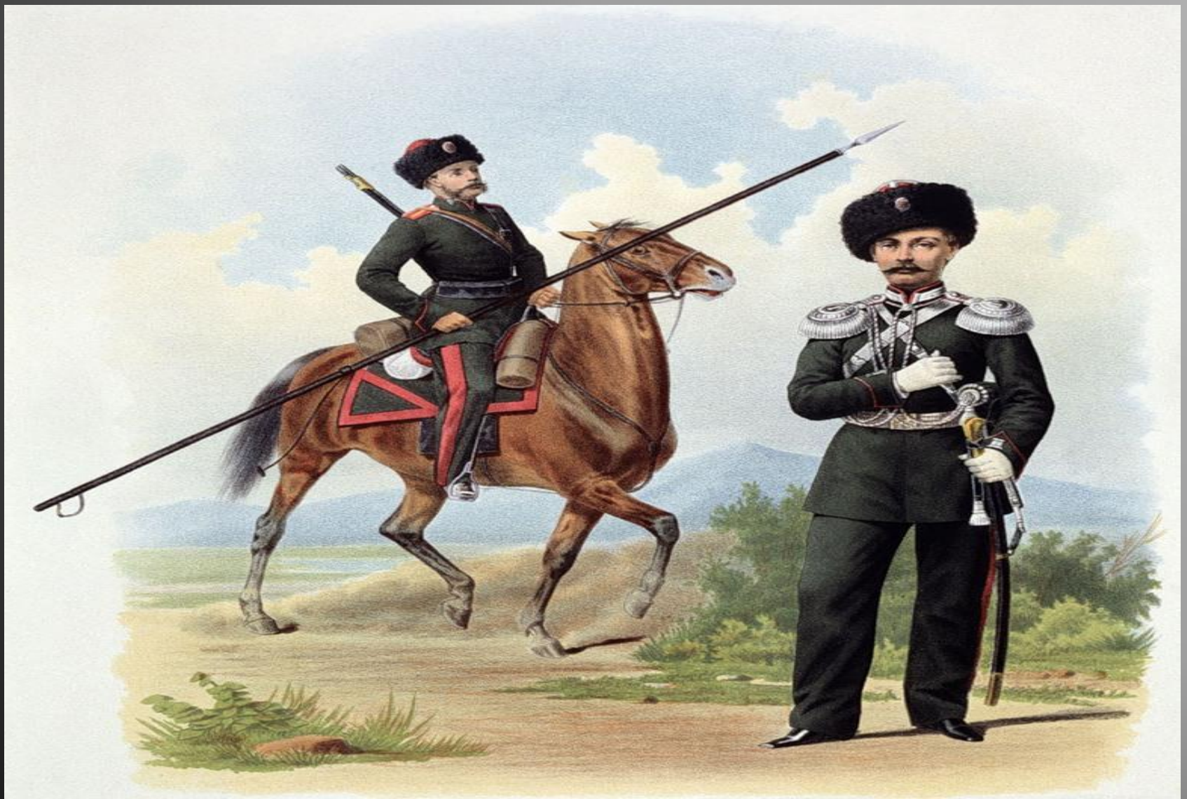
Казак и штаб-офицер Семиреченского Казачьего войска (парадная форма)