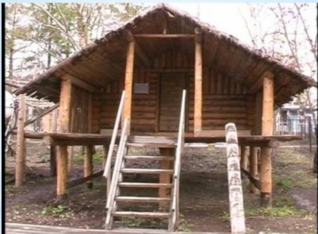
Летнее жилище – ке-раф