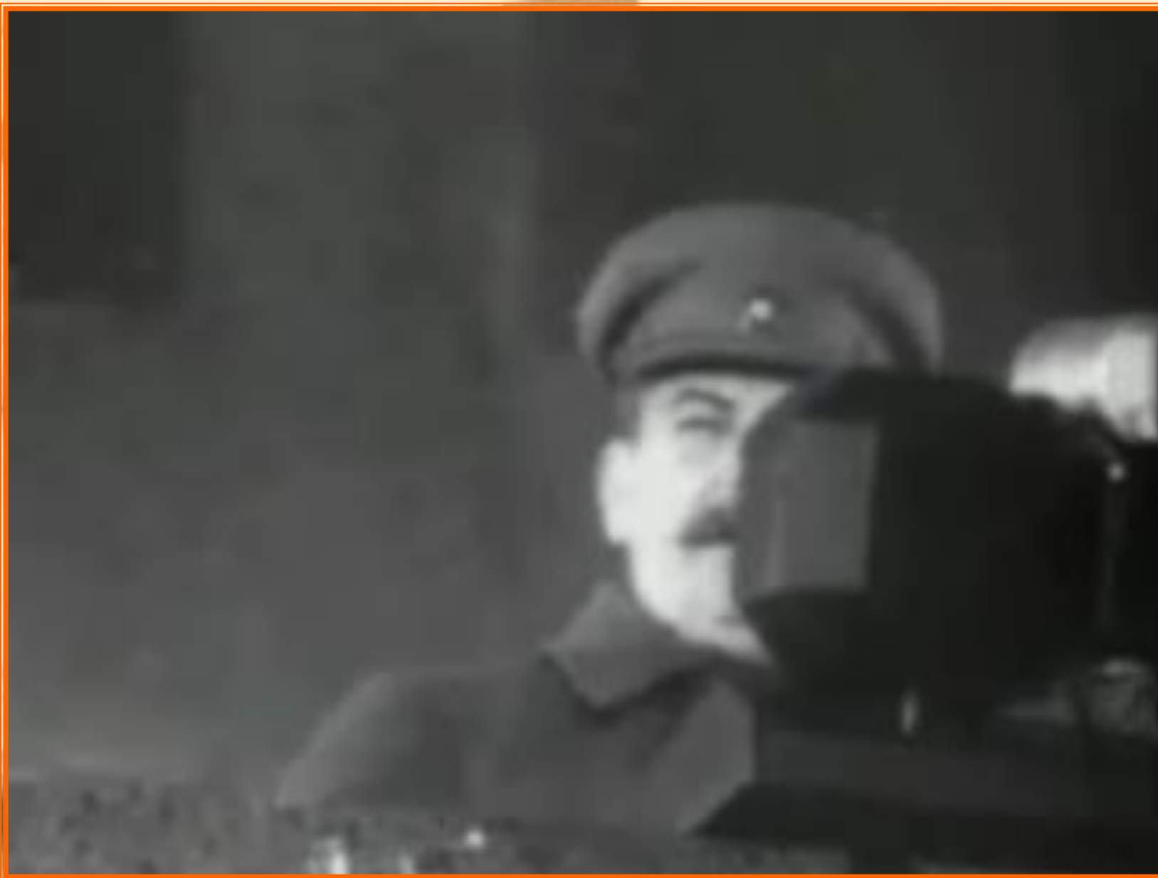
Речь И.В. Сталина на параде 7 ноября 1941 г.