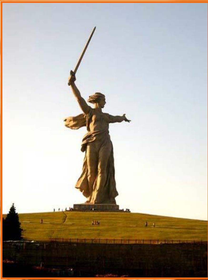
Мемориал Мамаев Курган

Дорогой ценой досталась Победа! В руинах 1710 городов и поселков, свыше 70 тысяч сел и деревень. Взорвано, разрушено около 32 тысяч промышленных предприятий, 65 тысяч километров железнодорожных путей. Уничтожено то, что было создано трудом нашего народа. Выведены из строя заводы, фабрики, затоплены шахты, истоптаны плодородные нивы. А точные человеческие потери до сих пор не подсчитаны.