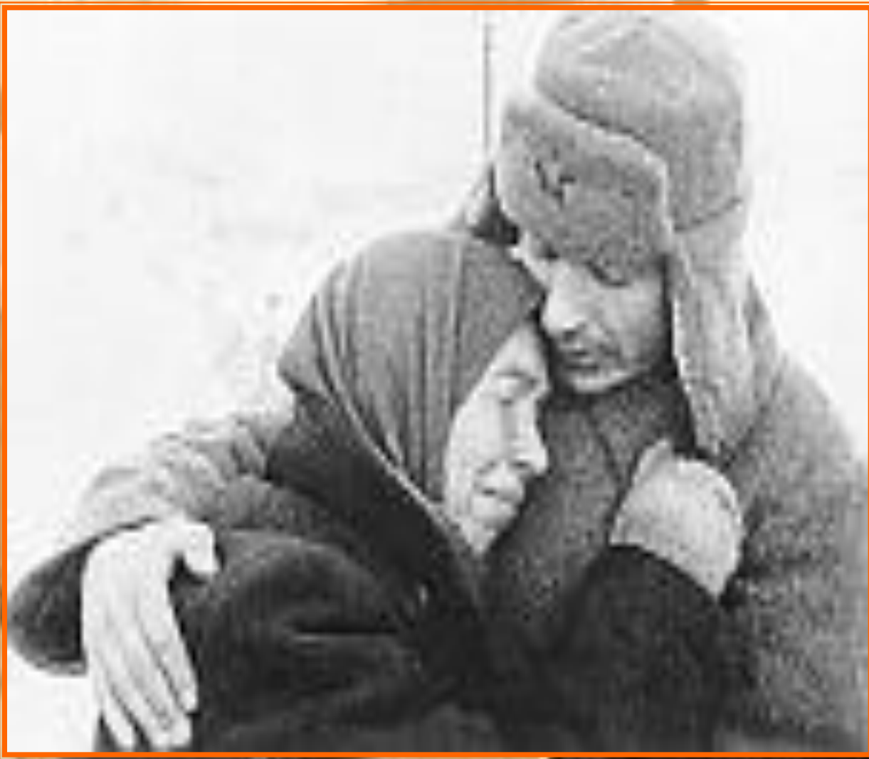
Прощание матери с сыном

В первые же часы войны на призывные пункты шли тысячи, а то и десятки тысяч людей желавших уйти на фронт добровольцами. Каждый из них желал спасти свою Родину от полчищ немецко-фашистских оккупантов и приблизить победу! Ни у кого не было сомнения в том, что враг скоро будет разбит!