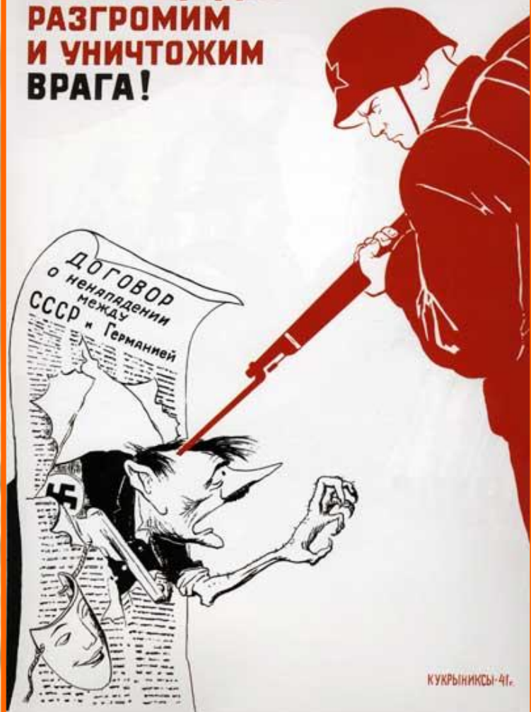
Плакат времен войны