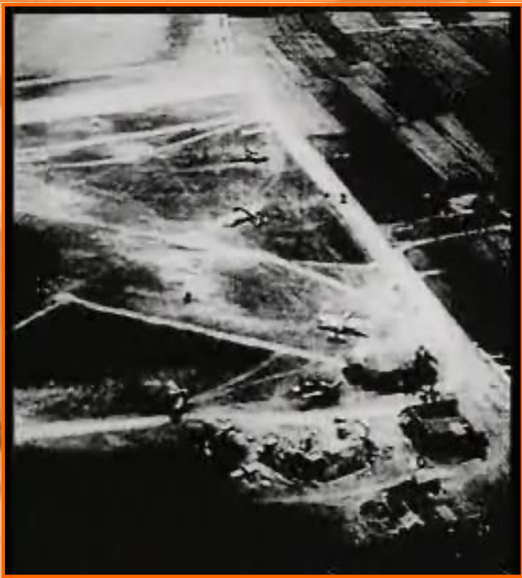
Трагическое начало. Фрагмент кинохроники.

Нападение фашистов было внезапным и потери Советского Союза в первые дни войны были значительными. Но продвижение гитлеровцев нельзя было назвать легкой прогулкой. За месяц боев в нашей стране фашисты потеряли в два раза больше солдат и офицеров, чем за 2 года боев в Европе.