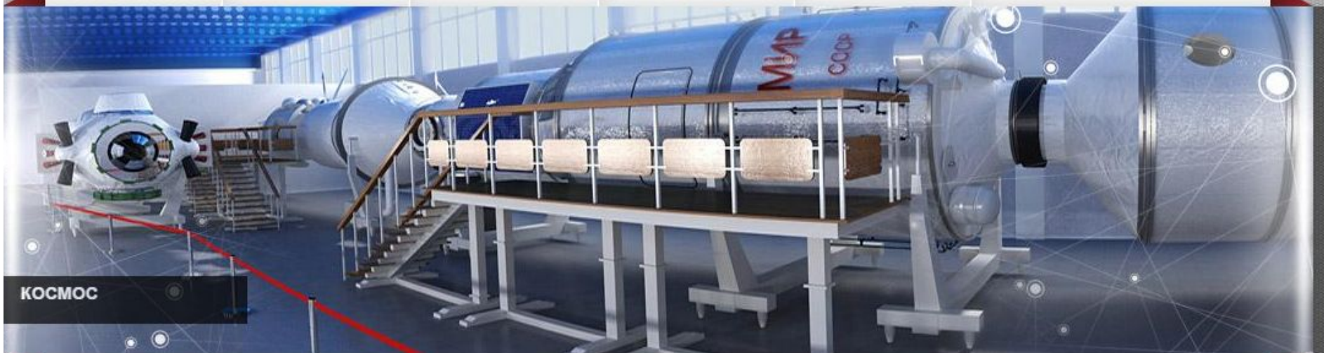
ФОТО / ВИДЕО