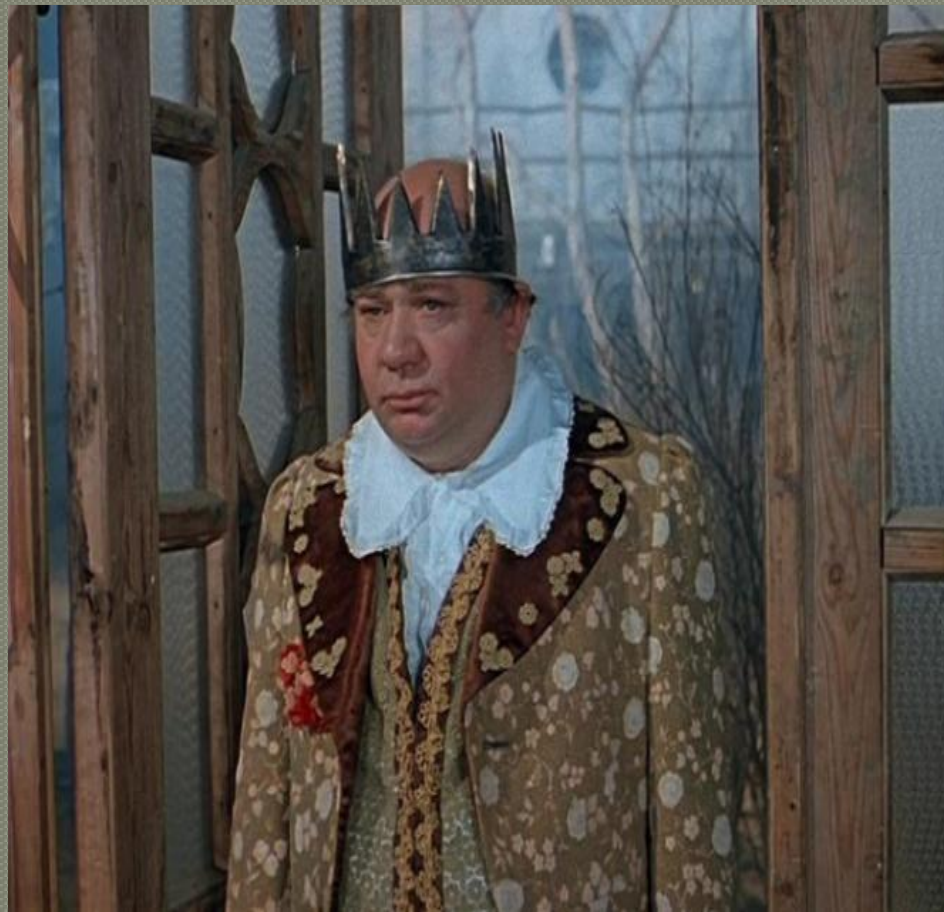
Кадр из фильма «Обыкновенное чудо»