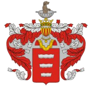
Герб семьи Баратынских