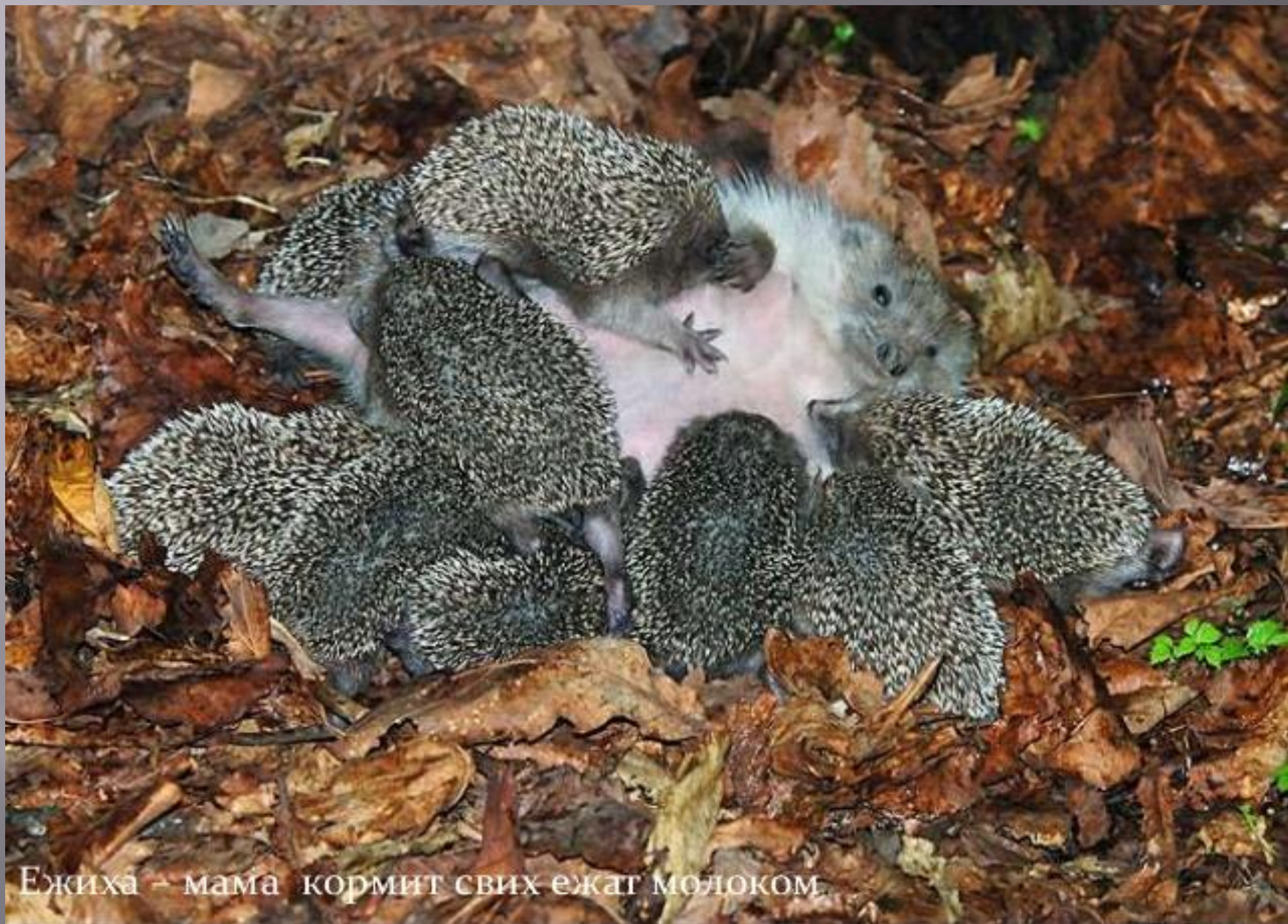
Ежиха – мама кормит свих ежат молоком