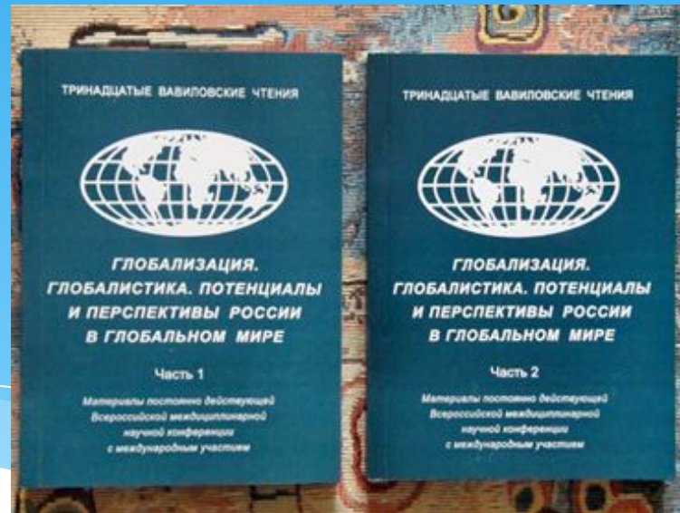
Сборник научных материалов Всероссийских Вавиловских чтений

Факультет является инициатором проведения постоянно действующей всероссийской весенней молодежной конференции с международным участием «Социально-гуманитарные науки в XXI веке: из опыта молодежных исследований». Участниками конференции являются не только студенты России, но и Белоруссии, Украины, Болгарии, США. Выпускаются международные сборники материалов.