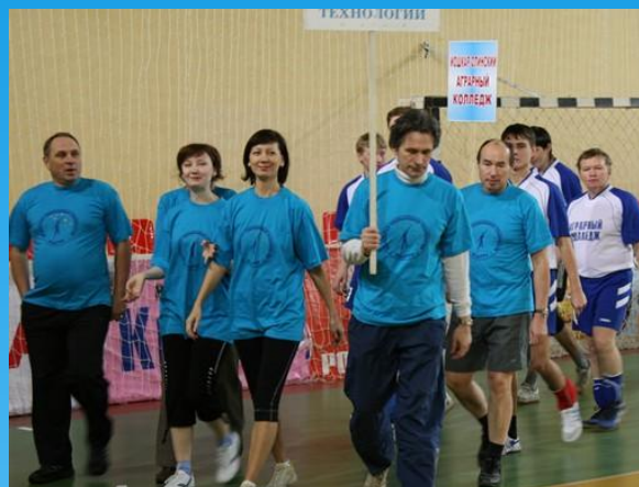
• Ежегодный спортивный фестиваль