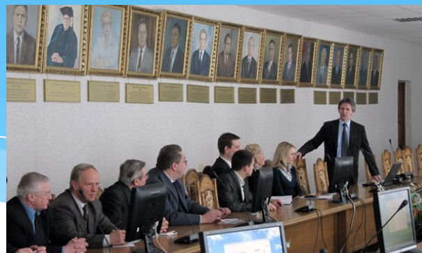
Заключение договоров о сотрудничестве ПГТУ и ФСТ с партнерами из Беларуси (г. Барановичи, г. Минск)