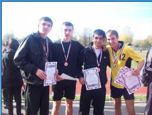
• Спортсмены ФСТ на осеннем марафоне