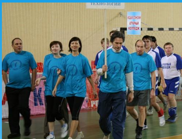
• Ежегодный спортивный фестиваль