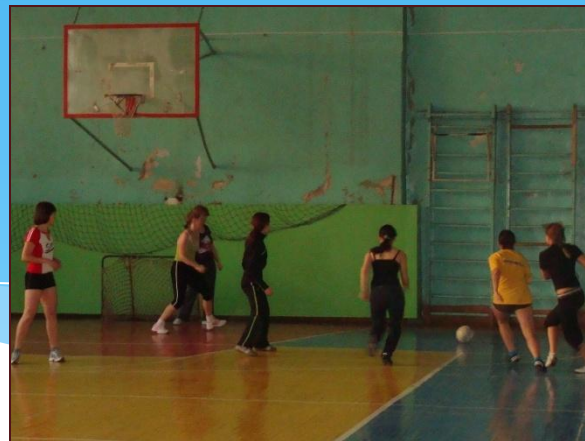
• Женский мини-футбол