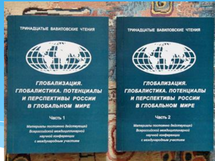
Сборник научных материалов Всероссийских Вавиловских чтений

Факультет является инициатором проведения постоянно действующей всероссийской весенней молодежной конференции с международным участием «Социально-гуманитарные науки в XXI веке: из опыта молодежных исследований». Участниками конференции являются не только студенты России, но и Белоруссии, Украины, Болгарии, США. Выпускаются международные сборники материалов.