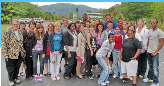
Делегация ФСТ с американскими студентами в университете «Конкорд», США, 2010 год