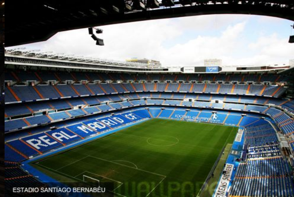
ESTADIO SANTIAGO BERNABÉU