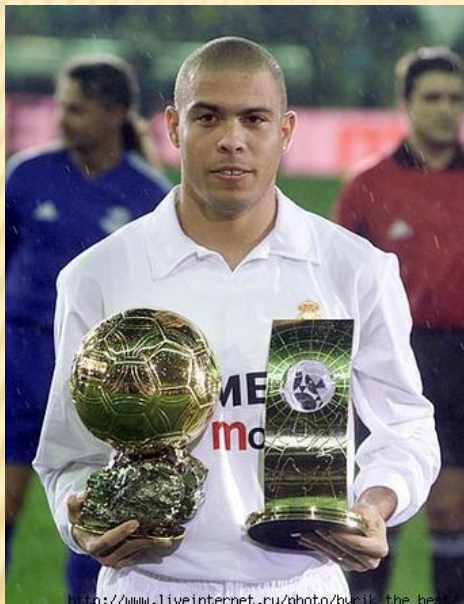
Р о н а л д о