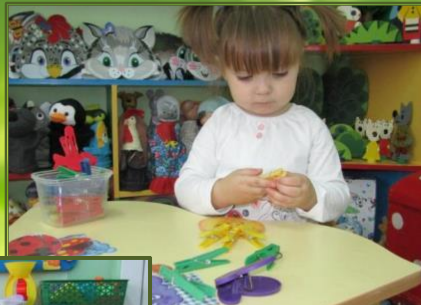
Игры с прищепками