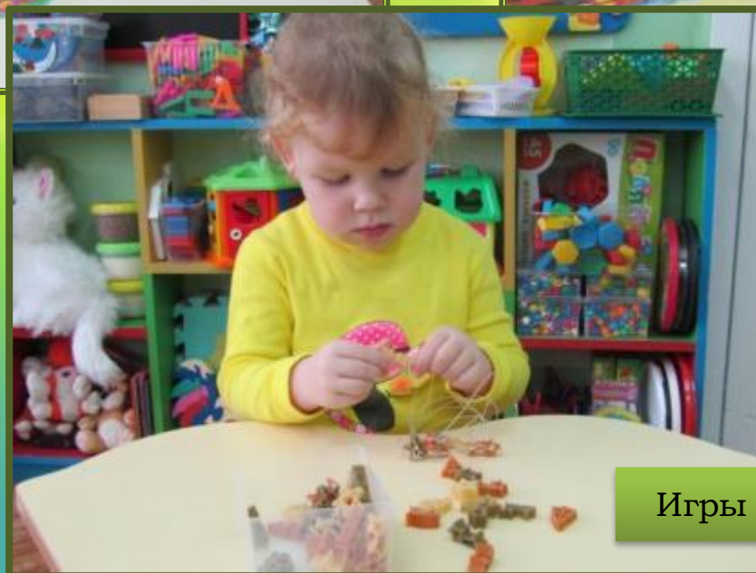
Игры с макаронами