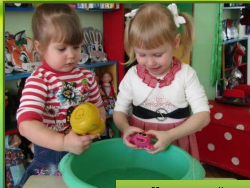
Игры с водой