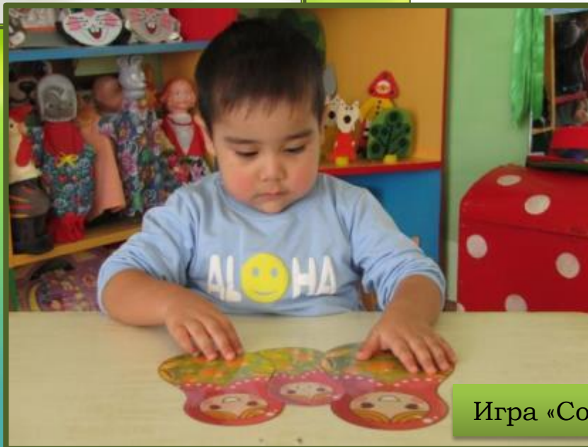
Игра «Собери матрешек по росту»