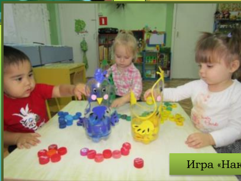
Игра «Накорми птичек»