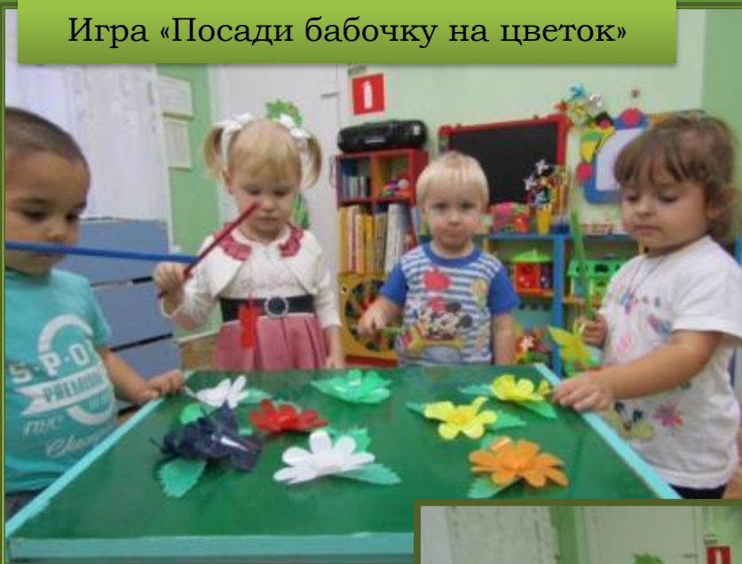
Игра «Посади бабочку на цветок»