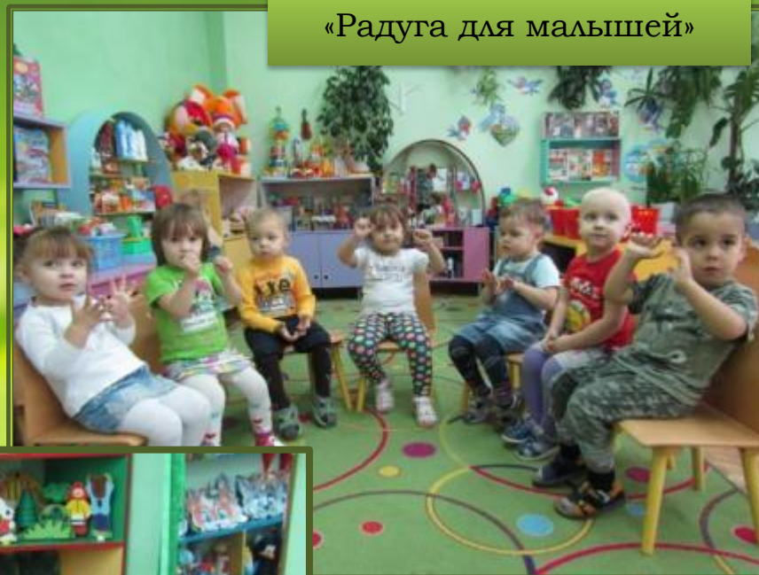
«Радуга для малышей»