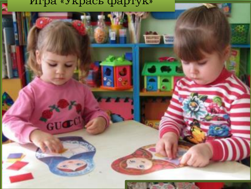
Игра «Украсть фардук»