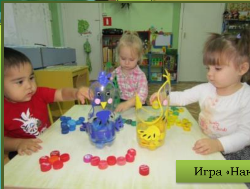
Игра «Накорми птичек»