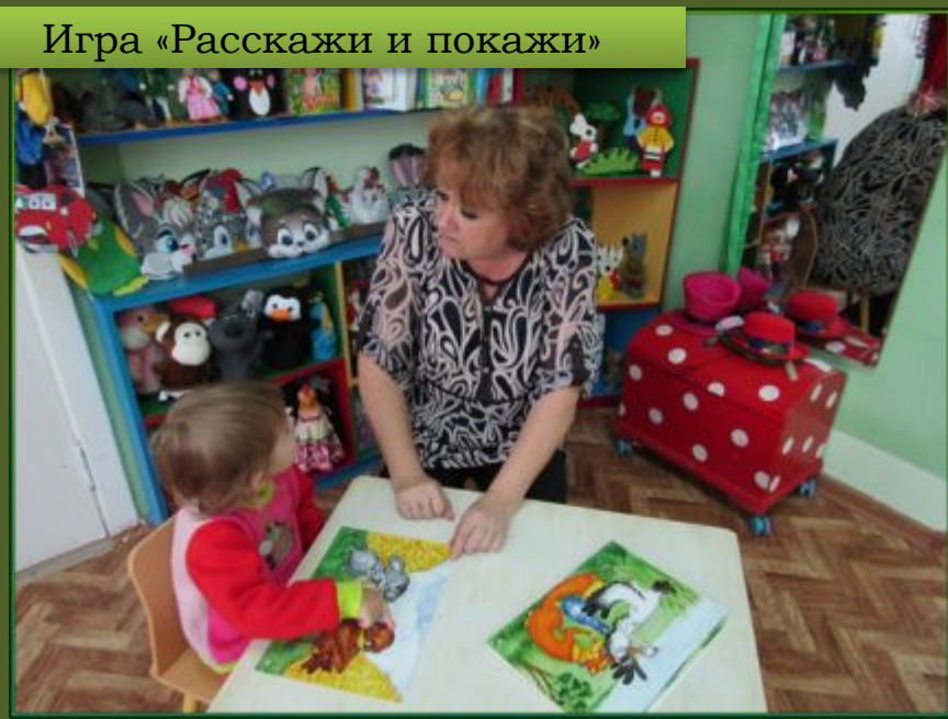
Игра «Расскажи и покажи»