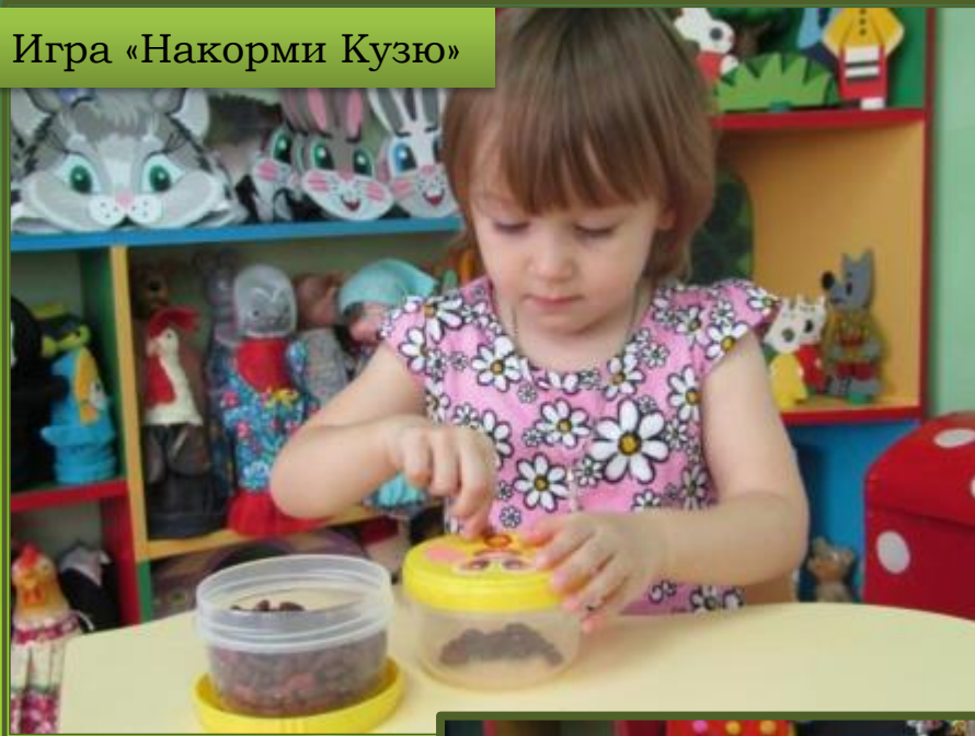
Игра «Накорми Кузю»