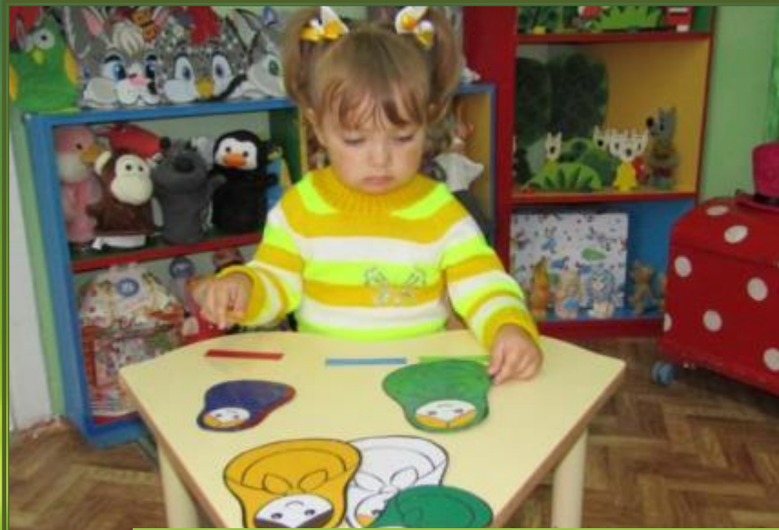
Игра «Разложи матрешек по цвету»