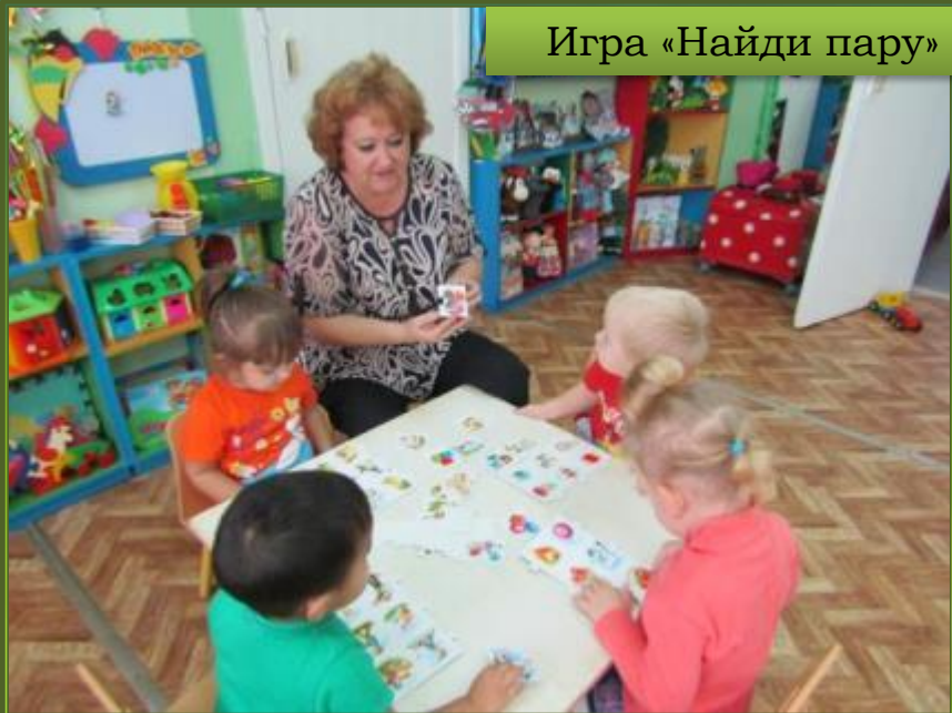
Игра «Найди пару»