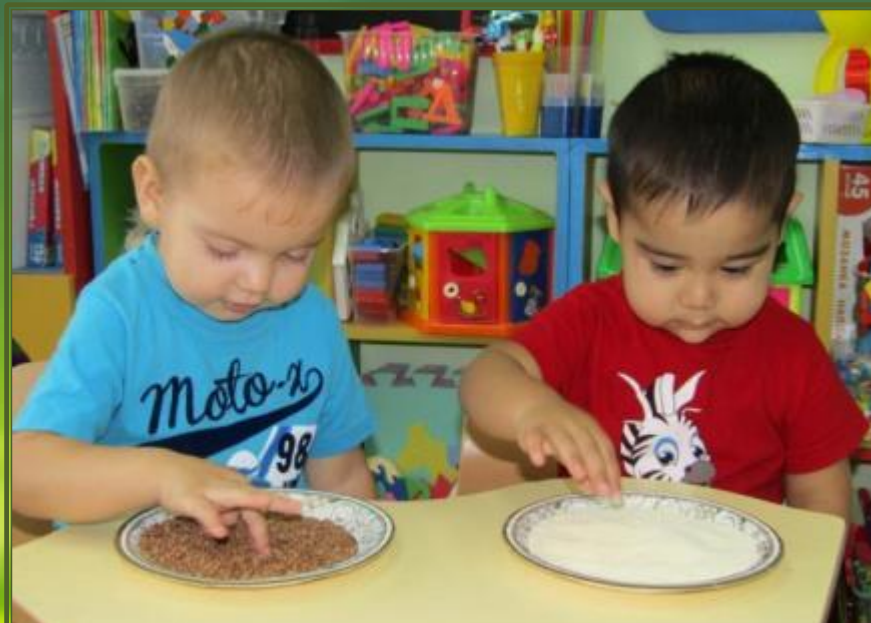
Рисование на крупе