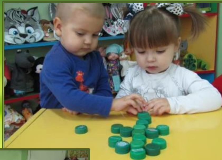
Игра «Сложи елочку»