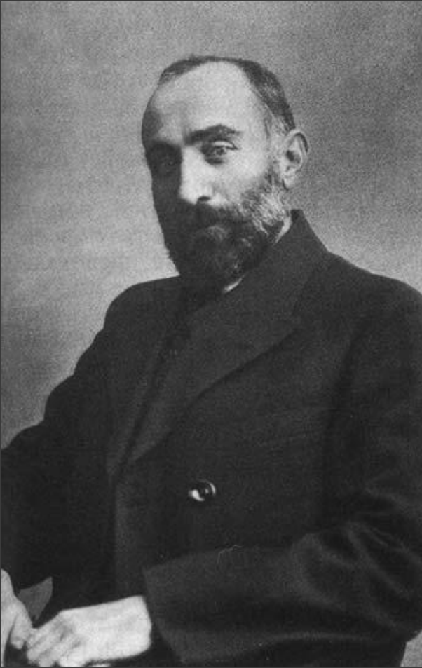
Чхеидзе Николай Семенович