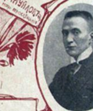
А. Ф. КЕРЕНСКИЙ, министръ юстиціи.