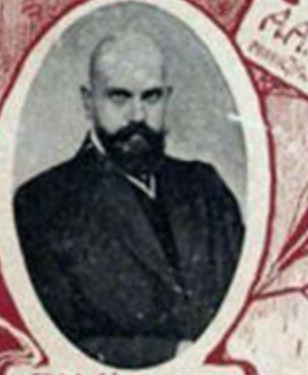
В. Н. ЛЬВОВЪ, оверъ-прокуроръ св. Синода.