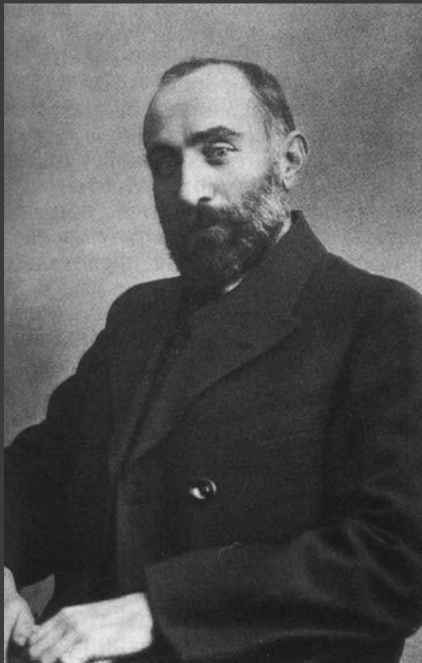
Чхеидзе Николай Семенович