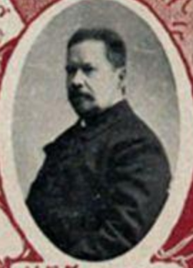
И. В. ГОДЕВЪ, посланникъ въ Берлинъ.