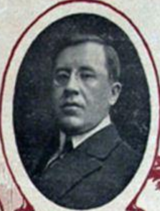
А. И. КОВАЛЕВЪ, мин. торговли и промышленности.