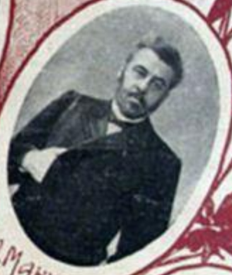
А. А. МАНИЛОВЪ, министръ финансовъ.