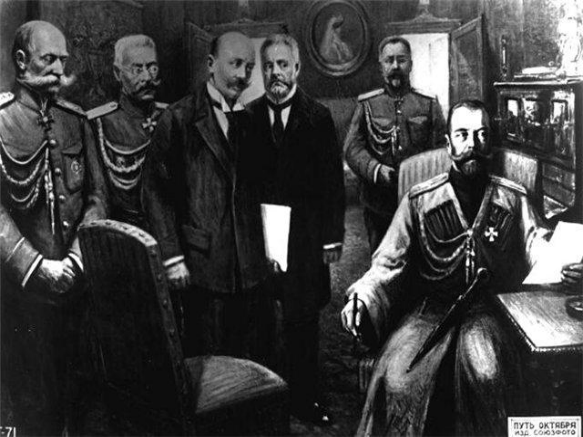
ПУТЬ ОКТЯБРЯ