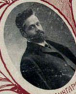
А. М. ШИНГАРЕВЪ, министръ земледѣлія.