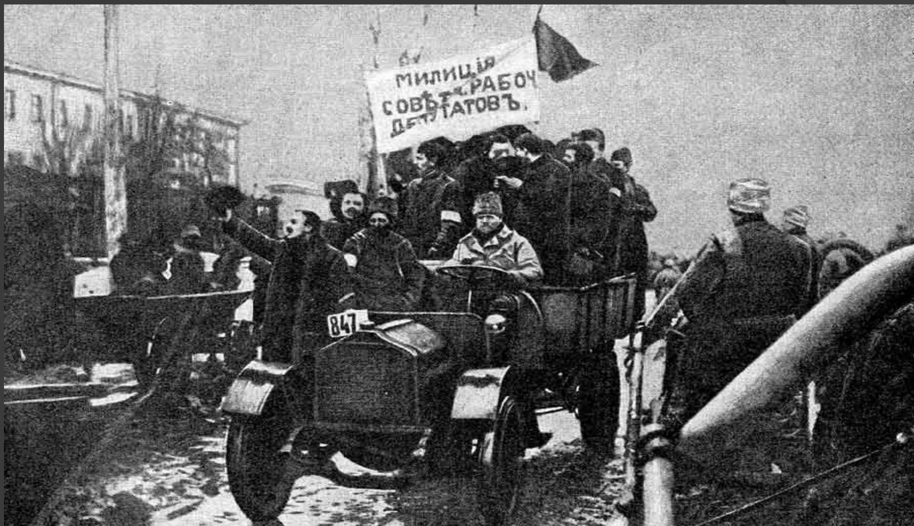
Петроград. Февраль 1917 года