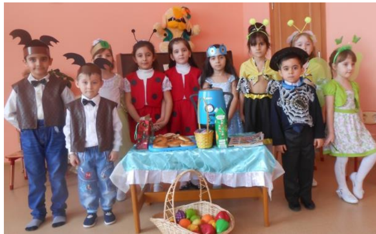
Сказка «Муха - Цокотуха»

Участие детей в театрализованных постановках позволяет осуществлять образование и развитие по всем направлениям: социально-коммуникативное, познавательное, речевое, художественно-эстетическое и физическое.