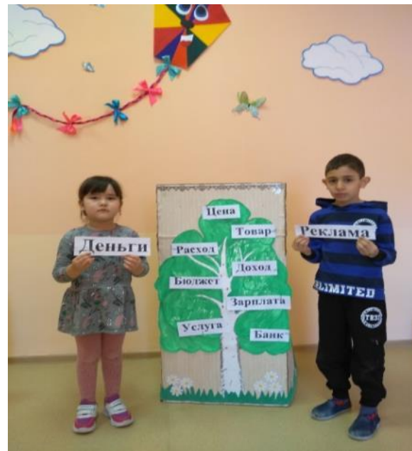
Развлечение «Азбука денег»