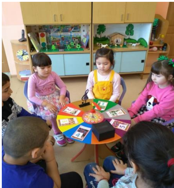
Интеллектуальная игра «Что? Где? Когда?»

Интеллектуальные игры способствуют развитию мыслительных способностей ребенка, умению анализировать, выделять главное, сравнивать, выбирать из различных вариантов, а также умению отстаивать свою позицию.