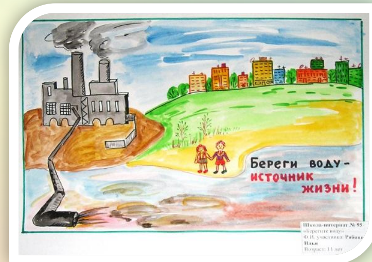
«Мастерская по экономии»