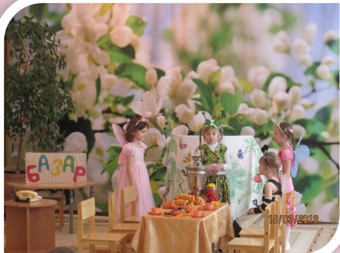
«Что? Где? Почем?»