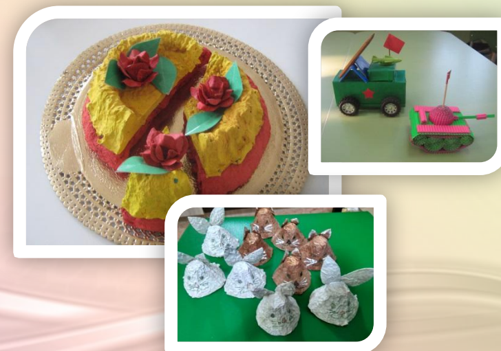
«Рождение новых вещей»