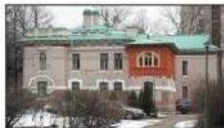
Д. Н. Кайгородов и его дом в Санкт-Петербурге

Да, Дмитрий Никифорович мечтал о том, чтобы школьники изучали природу не только в классах, но и в самой природе!