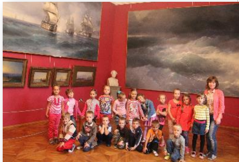
Картинная галерея Айвазовского