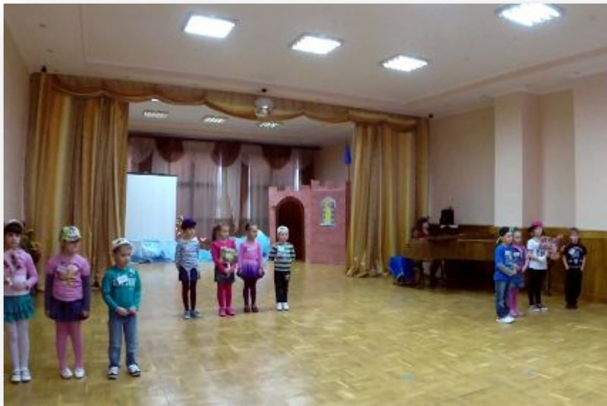
«В поисках сокровищ»