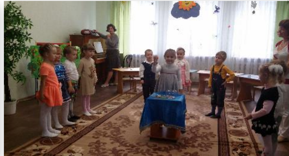
«Чем больше в мире красоты, тем счастливей я и ты»