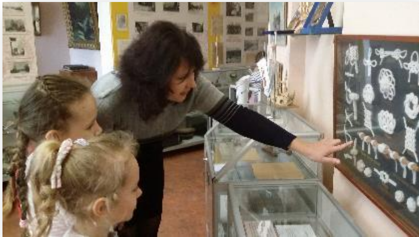
Музей клуба порта