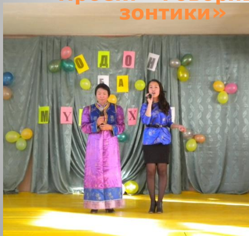
Проект «Одон ба мушэхэн» со своей выпускницей