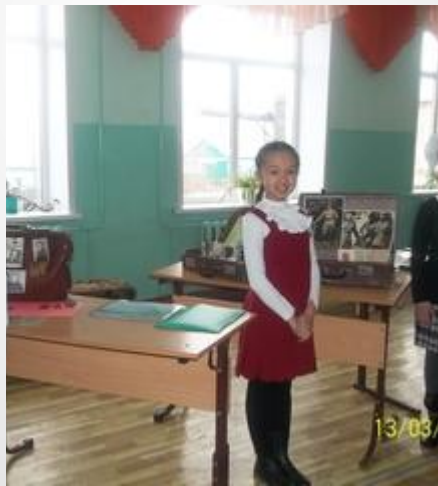
Проект «Семейный чемоданчик» к 9 Мая