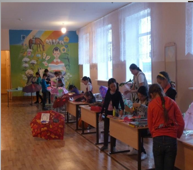
Проект «Говорящие зонтики»