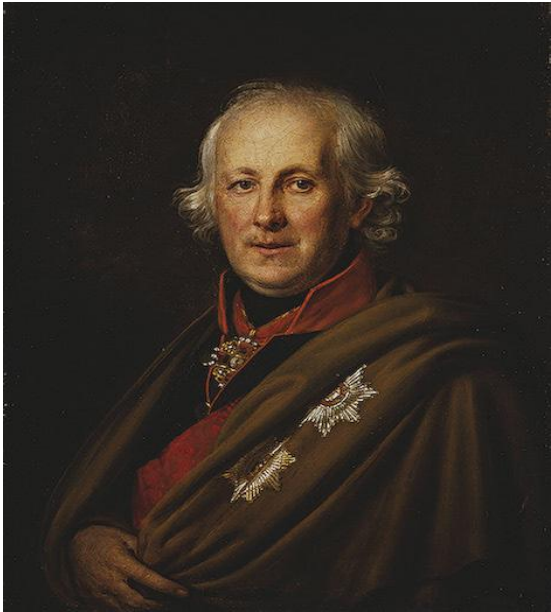
Николай Семенович Мордвинов