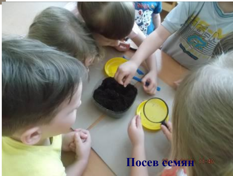
Посев семян 09.04.2016 11:40