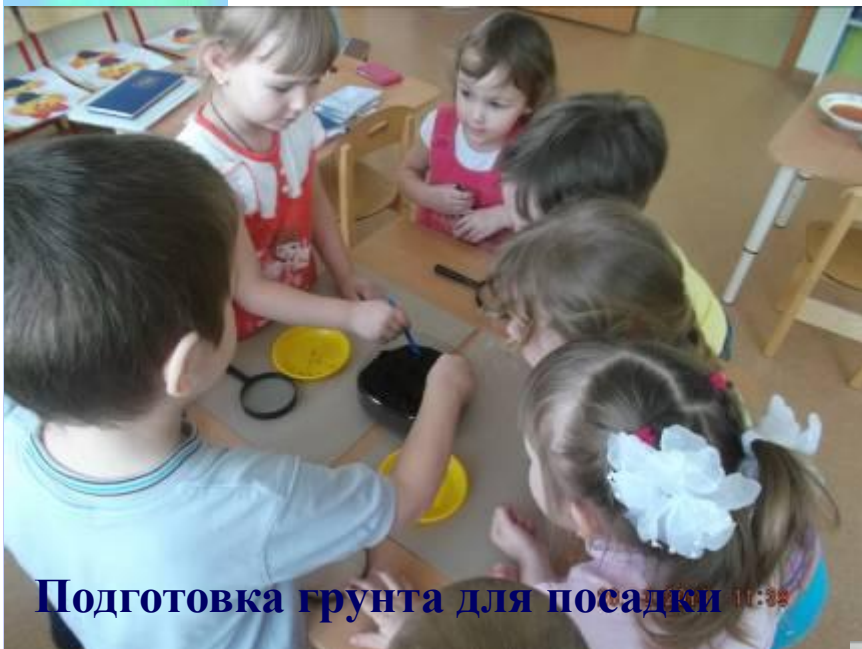
Подготовка грунта для посадки 09.04.2016 10:35