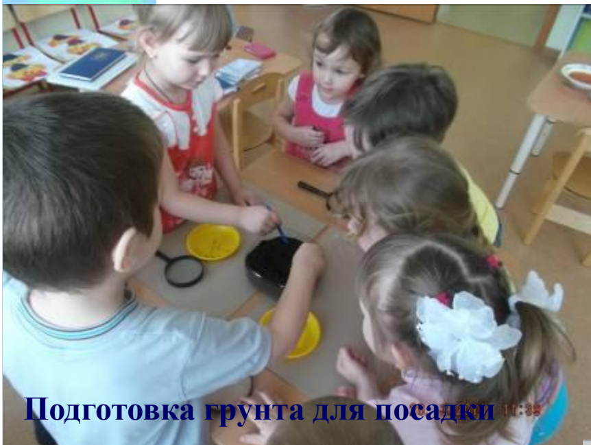
Подготовка грунта для посадки 10:35