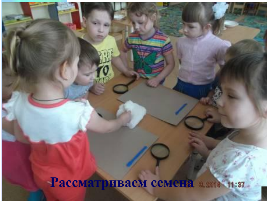
Рассматриваем семена 31.10.2014 11:37