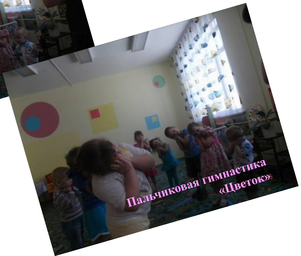
Пальчиковая гимнастика «Цветок»