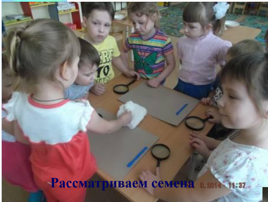
Рассматриваем семена 31.10.2014 11:37