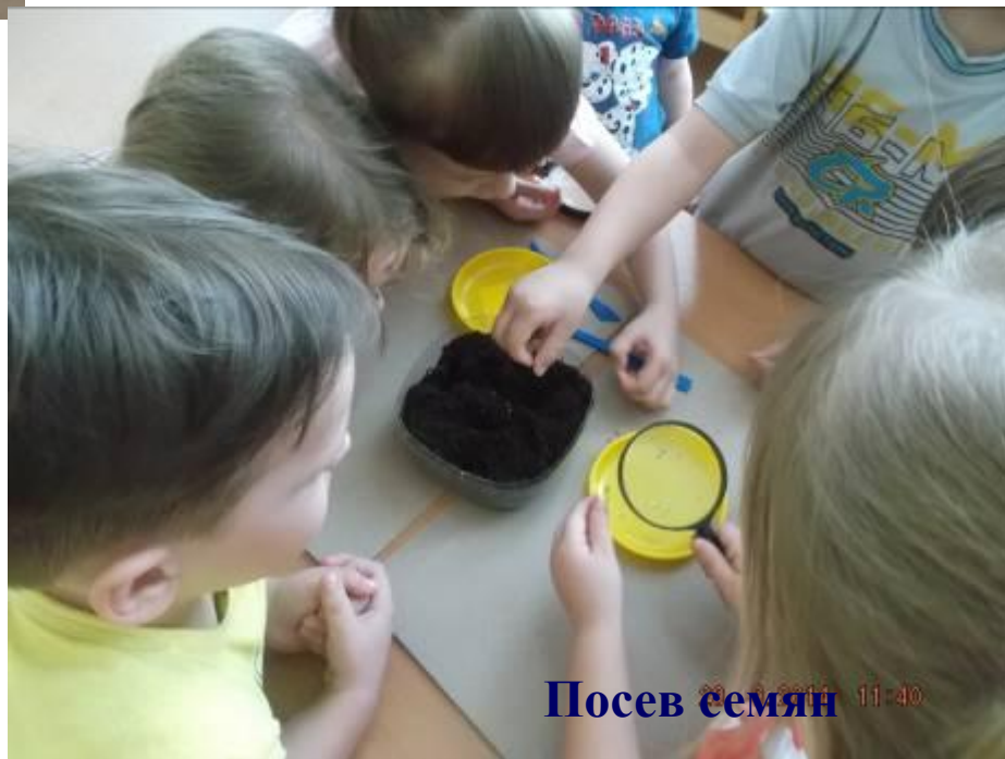
Посев семян 11:40