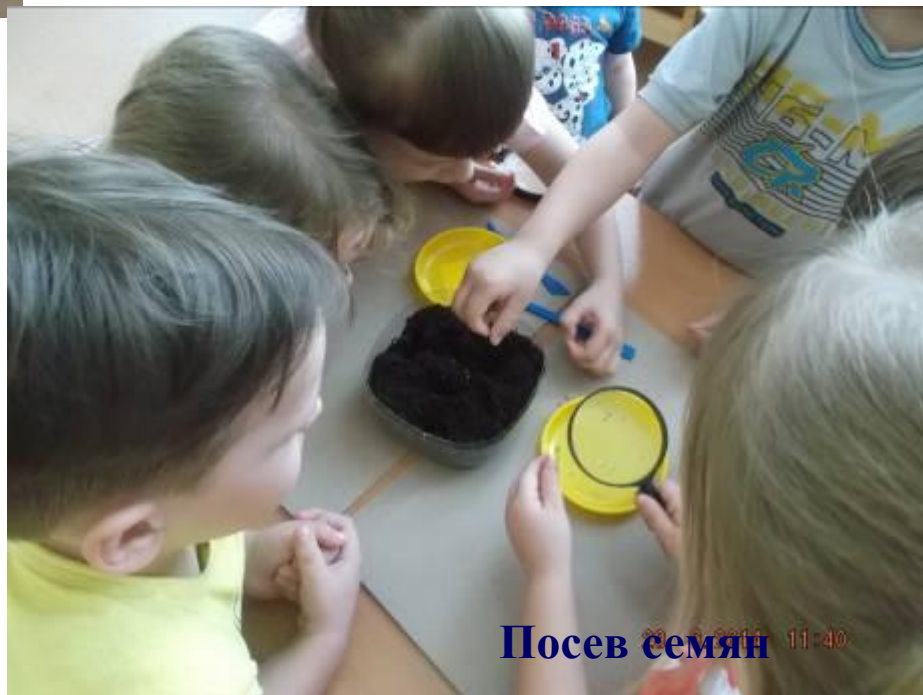
Посев семян 09.04.2016 11:40