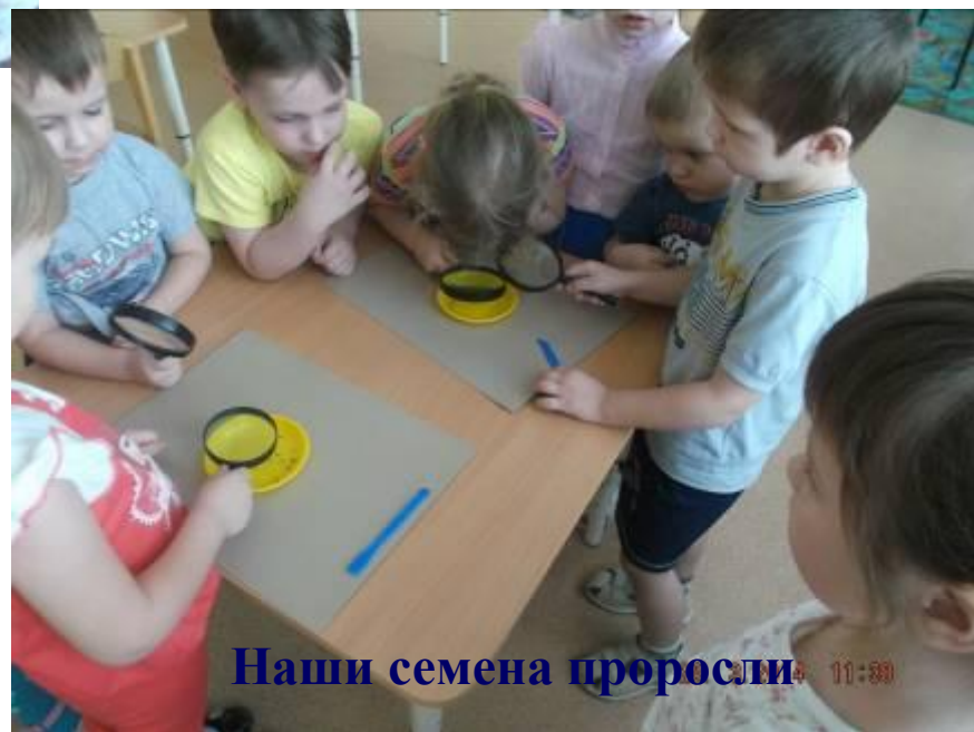
Наши семена проросли 31.10.2014 11:39