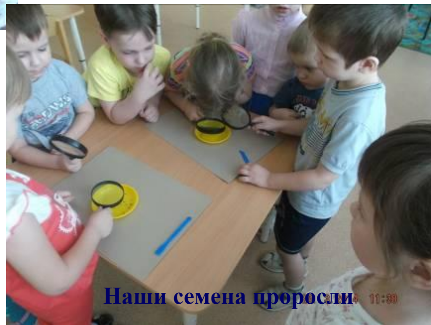
Наши семена проросли 31.10.2014 11:39